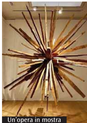
Un'opera in mostra

La Fondazione Culturale San Fedele, in collaborazione con la Galleria Giampaolo Abbondio, fino al prossimo 30 maggio presenta la mostra 153 Peter Belyi. The Silences of the Apocalypse personale dell'artista russo di rilievo internazionale, vincitore di numerosi premi. Proiettandoci in un tempo post-apocalittico, Belyi ci conduce in un paesaggio simbolico fatto di rovine e memorie perdute. Nella sua ricerca artistica ogni frammento sembra custodire l'eco di un mondo passato che risuona però nel presente, evocando tragedie senza volto, violenze consumate, dolori di un'umanità schiacciata da ideologie ormai crollate. Eppure, non si evidenzia nessun racconto compiuto: la storia resta frammentaria, sospesa tra le pieghe del tempo. Ci si chiede: da dove provengono questi materiali, muti ma impregnati del dolore della storia? Sono i segni di una catastrofe dimenticata, o, più sottilmente, messaggeri di un futuro che ci attende, imminente e incerto? Belyi ci immerge in un abisso, in un silenzio che ci pone al cuore stesso del senso del nostro essere nel mondo. Un monito rivolto oggi ai potenti del nostro tempo? La mostra è aperta presso la Galleria San Fedele a Milano (Galleria Hoepli, 3b) da martedì a sabato, dalle 14 alle 18. Ingresso libero. Per informazioni: centrosanfedele.net .