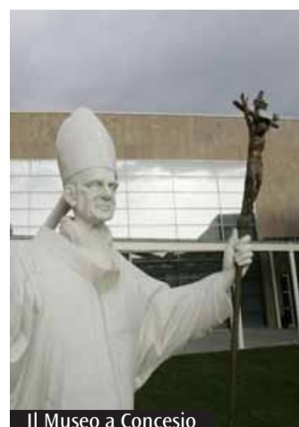
Il Museo a Concesio

Boniforti. Dopo una pausa alle 16, i partecipanti saranno suddivisi in tre gruppi per sperimentare direttamente i diversi metodi proposti. La giornata si concluderà alle 18 con il rientro in plenaria e un momento di preghiera. È previsto un servizio di babysitteraggio, da richiedere al momento dell'iscrizione online. Per partecipare è necessario iscriversi entro la mattina di venerdì 24 aprile, compilando la scheda di iscrizione disponibile online sul portale www.chiesadimilano.it/famiglia . Sempre online è disponibile anche una guida per scegliere il metodo da sperimentare.