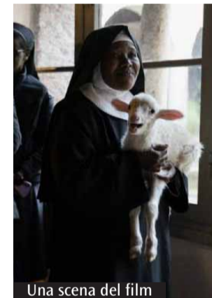
Una scena del film