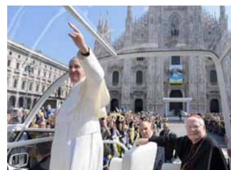
Un momento della visita di papa Francesco a Milano, il 25 marzo 2017: qui in piazza Duomo con l'allora arcivescovo, cardinale Angelo Scola

tavano inevitabilmente a parlare di conversione della Chiesa. Il cammino sinodale è stato, per Bergoglio, il punto di non ritorno di tale conversione? «Il concetto di sinodalità è stato paradigmatico di una Chiesa che impara, al suo interno e tra nelle sue relazioni, a valorizzare ciascuno, a riconoscere tutti doni e i carismi. Questo camminare insieme del Sinodo universale (di cui Costa è stato segretario speciale, ndr) ha portato a qualcosa di molto profondo che papa Leone ha ripreso come logica di unità nel proprio magistero. Nella Messa per il Giubileo delle equipe sinodali e degli organi di partecipazione ha chiesto, infatti, di proseguire in un cammino contro le divisioni e le polarizzazioni». Il 25 marzo 2017 papa Bergoglio visitò Milano. Il giorno successivo nella preghie-