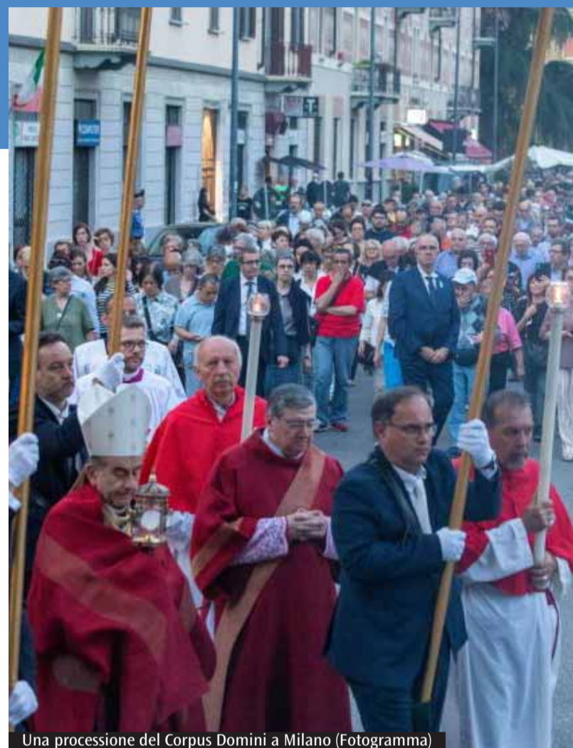
Una processione del Corpus Domini a Milano

Il volume offre una mappatura aggiornata di parrocchie, comunità pastorali, decanati e zone pastorali, insieme a un censimento di persone, enti, associazioni e organizzazioni. Completamente rinnovata la sezione vita consacrata