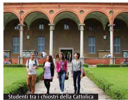
Studenti tra i chiostrini della Cattolica

di immaginare alternative. In occasione della Giornata per l'Università cattolica, è nelle librerie il Rapporto Giovani 2026 , al quale è dedicato un sito web specifico ( www.rapportogiovani.it ). Pubblicato da Il Mulino e promosso dall'Istituto Giuseppe Toniolo in collaborazione con Ipsos, con il sostegno di Fondazione Cariplo, il Rapporto evidenzia come i giovani di oggi non siano segnati da una singola crisi, ma da una sequenza continua di shock che ha reso l'incertezza la loro condizione di partenza. I giovani chiedono, tuttavia, di essere protagonisti. Rivendicano spazio, voce e opportunità. In Italia, però, persistono diversi