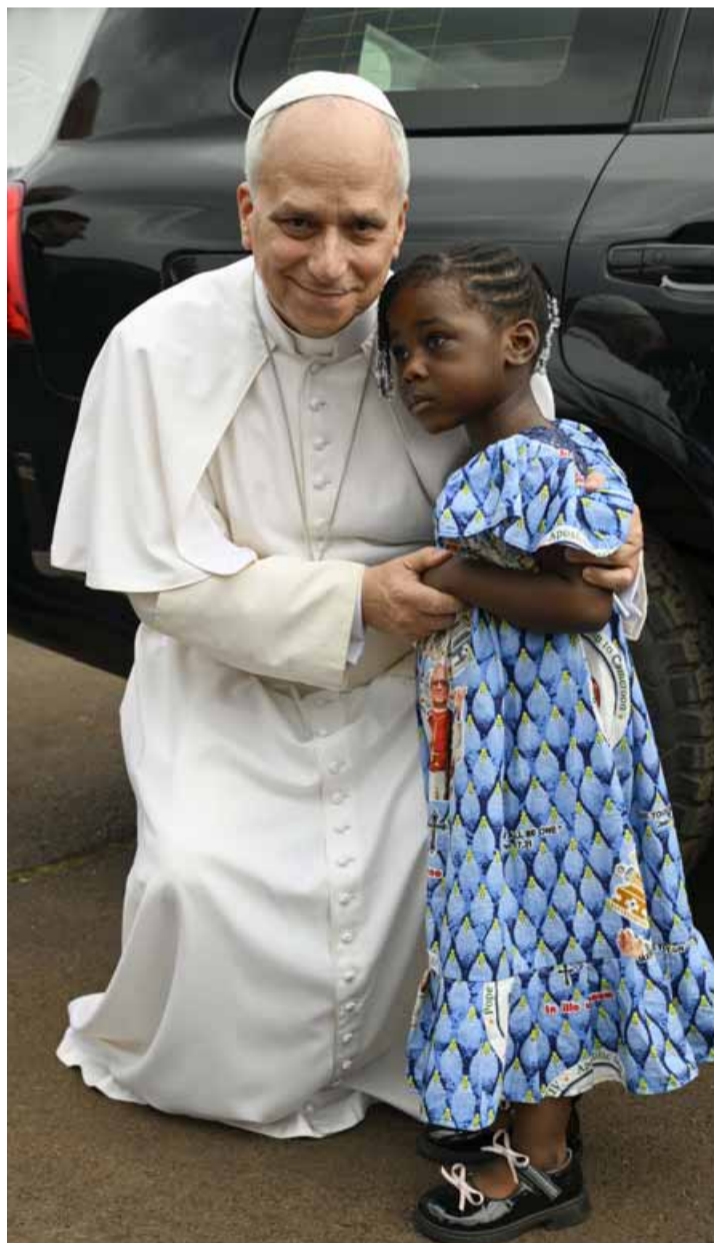
Papa Leone XIV durante la sua visita in Camerun

«Vorrei anzitutto ringraziare papa Leone XIV per le sue prese di posizione a favore della pace, ribadite, fin dalla sera della sua elezione al Soglio. I suoi richiami alle guerre che sono sulle prime pagine dei giornali, ma anche ai conflitti dimenticati, non possono che muovere le nostre coscienze e spingerci a ringraziare per il suo costante operato». Alla vigilia del viaggio apostolico del Papa in Africa (in corso fino al 23 aprile), il vicario generale mons. Franco Agnesi ha voluto rinnovargli «la vicinanza, l'affetto e la preghiera» della Chiesa ambrosiana «auspicando rispetto per la sua persona e il suo ministero» in merito ai recenti attacchi di Trump. «Chiedere la pace, da parte del Pontefice, non indica, evidentemente, un messaggio politico, ma di umanità e di fede scritto nel Vangelo. Credo che le sue parole, al di là delle sconcertanti affermazioni del presidente degli Stati Uniti - per cui non esiste una giustificazione possibile -, siano anche di monito e di auspicio per il suo quarto viaggio apostolico che si svolge in un continente devastato dai conflitti e dalla povertà come è l'Africa». Martedì scorso, a margine di un incontro in Cattolica, l'arcivescovo ha definito le parole di Trump, «una cosa così poco educata. Mi dispiace per il popolo americano che deve vergognarsi del suo presidente».