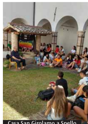
Casa San Girolamo a Spello

sù crocifisso». «Andare al cuore delle cose» significa allora ritrovare un centro capace di allineare tutte le nostre dimensioni: desideri, relazioni e scelte quotidiane. Non mancheranno strumenti concreti per il «dopo». «La prima è tornare nella propria comunità: la fede non è mai soltanto individuale, e poi darsi delle priorità nel cammino di fede». E a chi è indeciso don Michael dice: «Ascolta l'inquietudine, il senso di insoddisfazione, che senti dentro. Il Vangelo propone sempre questo: vieni e vedi». Sarà anche un tempo di gioia condivisa, amicizia e festa, per scoprire insieme ad altri giovani una fede capace di parlare alla vita concreta di oggi. Per informazioni e iscrizioni: cardiopgmilano@gmail.com indicando nome, cognome e recapito telefonico, per essere ricontattati.