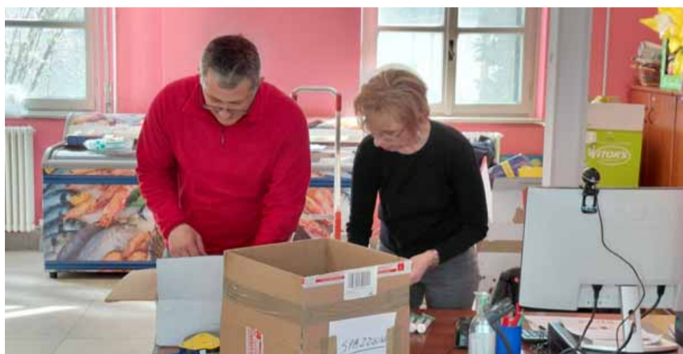
A destra, la sede della Casa della carità a Seregno, intitolata a papa Francesco. A sinistra, due volontari impegnati nell'Emporio solidale