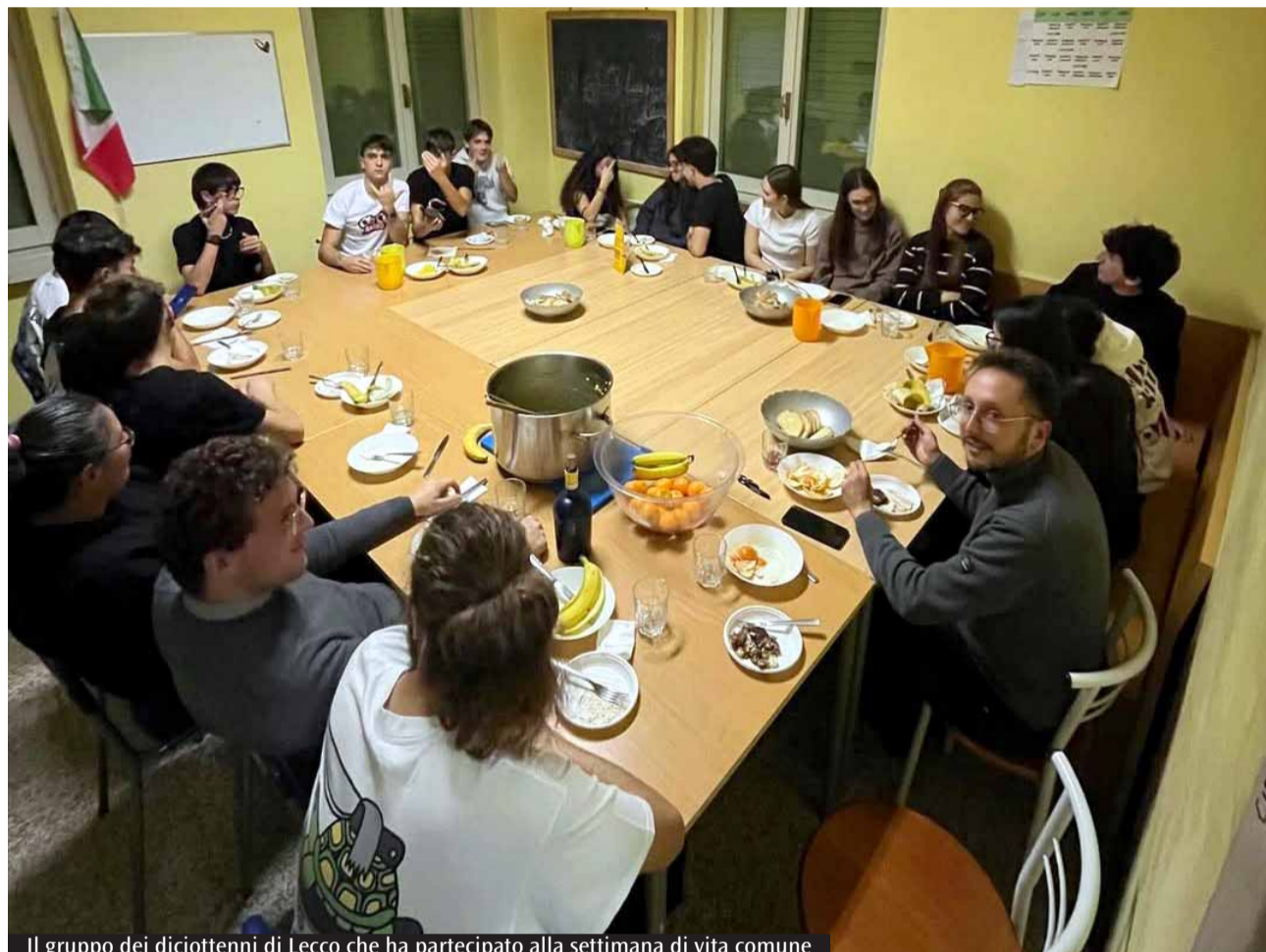
Il gruppo dei diciottenni di Lecco che ha partecipato alla settimana di vita comune