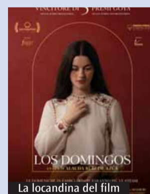
La locandina del film

MetaCinema è un innovativo progetto promosso da Acec, che trasforma le sale cinematografiche in spazi di interazione dinamica tra pubblico, attori e registi. Grazie a un avanzato sistema di regia video e strumentazioni tecnologiche, le sale vengono connesse in videoconferenza, permettendo un dialogo diretto con i protagonisti del grande schermo. L'esperienza supera la tradizionale visione passiva, offrendo agli spettatori un coinvolgimento attivo e immersivo, arricchendo così il valore culturale e sociale del cinema. Queste le sale lombarde aderenti a MetaCinema: Lograto, Besnate, Ospitaletto, Merate, Chiavenna, Gorgonzola, Sala Gregorianum a Milano.