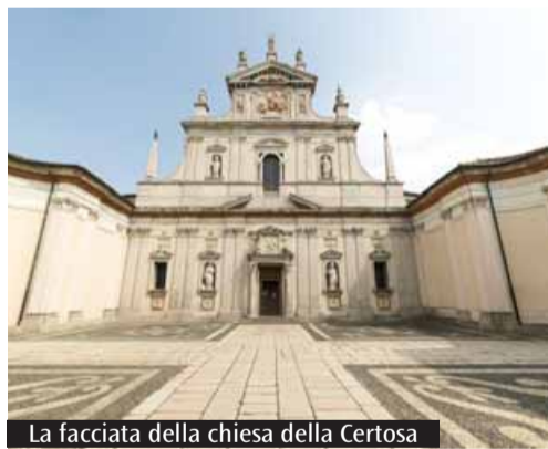
La facciata della chiesa della Certosa

Per informazioni e visite alla Certosa di Garegnano (via Garegnano, 28) consultare il sito dedicato: certosadimilano.com .