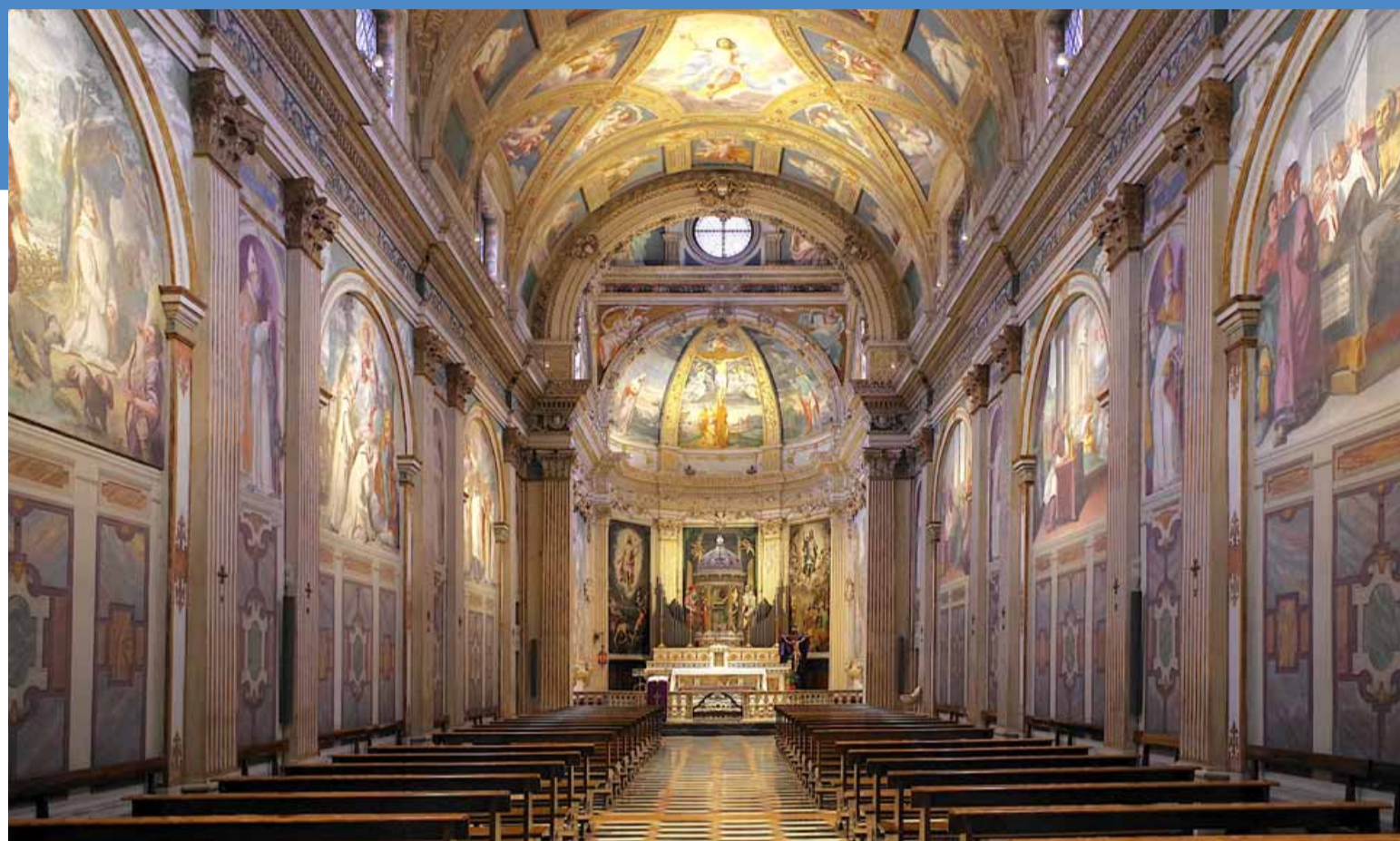
L'interno della chiesa di Santa Maria Assunta della Certosa di Garegnano con la nuova illuminazione