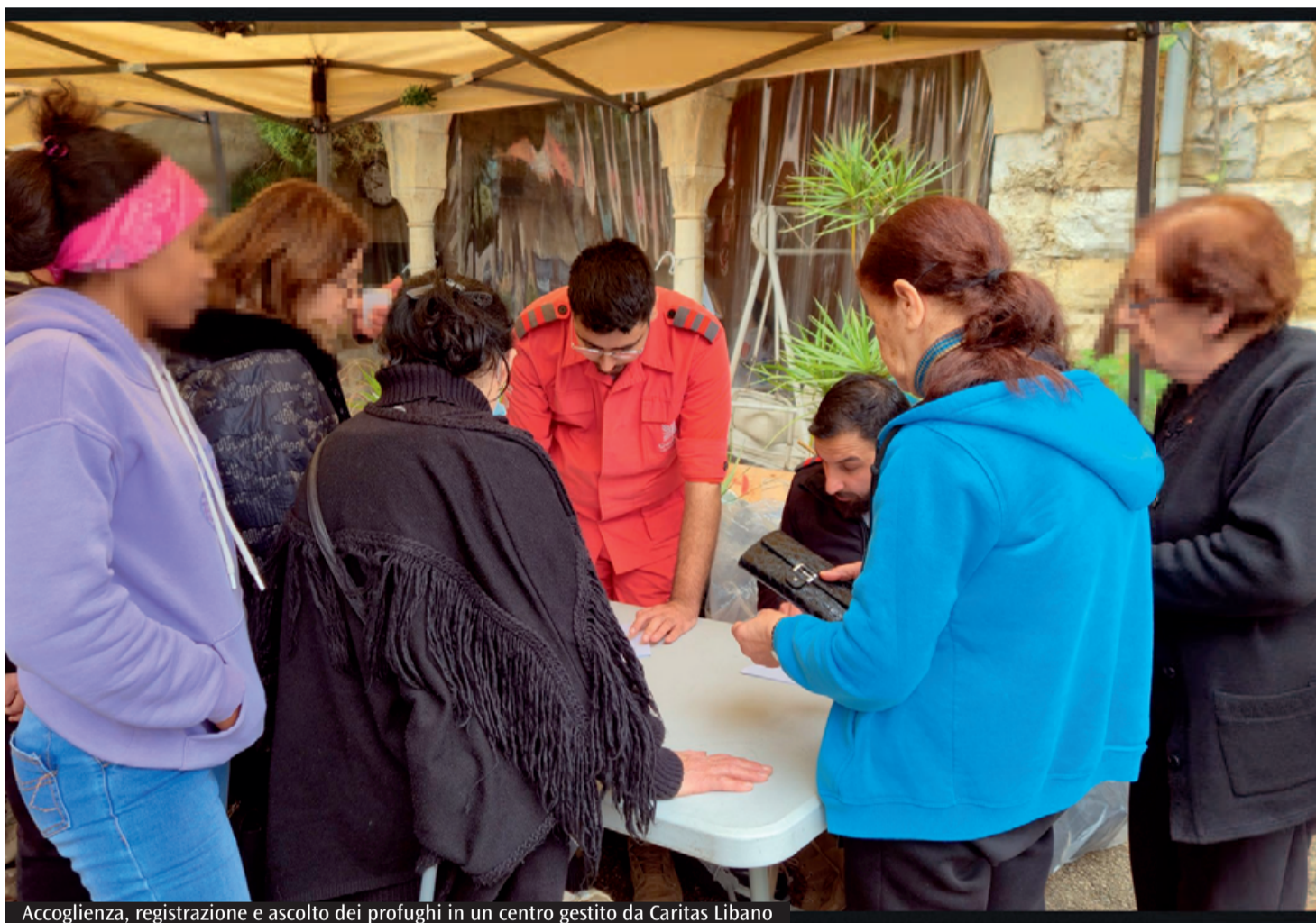
Accoglienza, registrazione e ascolto dei profughi in un centro gestito da Caritas Libano