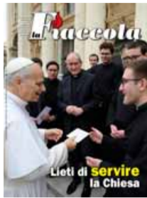
Lieti di servire la Chiesa

Per ricevere La Fiaccola contattare il Seminario di Venegono (tel. 0331.867111, email segretariato@seminario.milano.it ). Per la versione digitale www.riviste.seminario.milano.it .