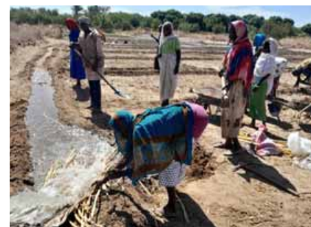
Donne al lavoro, nel progetto Caritas degli orti comunitari, per sostenere le comunità di Sudan e Ciad, ma anche i campi dei profughi

dati al lavoro di 61 gruppi di donne, che hanno migliorato l'alimentazione e il reddito di oltre 5 mila persone tra sudanesi e ciadiani residenti nei villaggi sottoposti alla pressione dei flussi di profughi (progetto «Il coraggio delle donne»). In parallelo, sono stati inoltre scavati e attrezzati con pompe 15 pozzi in altrettanti villaggi, finalizzati a consentire l'accesso all'acqua potabile e a migliorare le condizioni igieniche di profughi e autoctoni (progetto «L'acqua è vita»). Con una parte (50 mila euro) dei fondi erogati da Caritas ambrosiana, si è provveduto inoltre ad affrontare i bisogni emergenziali dei profughi accolti, a ondate successive, nel campo di transito costituitosi a Tiné, alla frontiera col Darfur, nello scorso gennaio. Oltre a consegnare kit protettivi (coperte, materassini, zan-