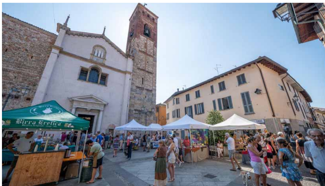
La Fiera di Santo Stefano davanti alla chiesa "madre" di Vimercate