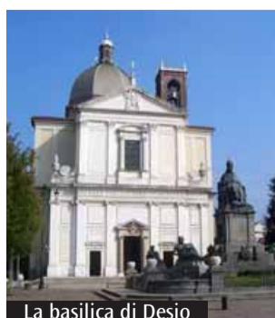
La basilica di Desio

Oggi il primo appuntamento nella basilica dei Santi Siro e Materno, a ingresso libero