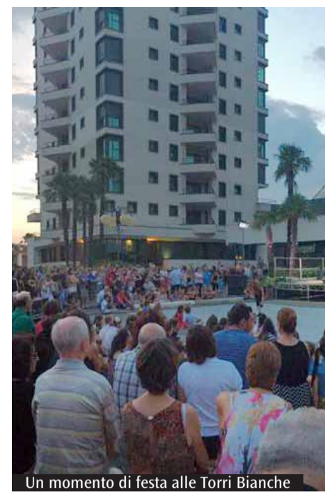
Un momento di festa alle Torri Bianche

avviato un lavoro condiviso per ripensare strategie e attività, puntando soprattutto sulla formazione degli educatori e su una maggiore corresponsabilità. Si cerca così di costruire una proposta educativa più solida e capace di adattarsi ai diversi contesti. Anche il doposcuola è riconosciuto come un ambito strategico, sia come sostegno allo studio sia come occasione educativa. Per questo si è investito nella formazione dei volontari, affrontando temi come la gestione dell'ansia scolastica, i disturbi dell'apprendimento e l'integrazione degli studenti di origine straniera. Nel complesso emerge una comunità dinamica e ricca di risorse, capace di fare rete e di offrire molte opportunità, ma chiamata ad ampliare la partecipazione e a coinvolgere nuove persone, evitando che l'impegno resti concentrato su pochi e favorendo una corresponsabilità più diffusa.