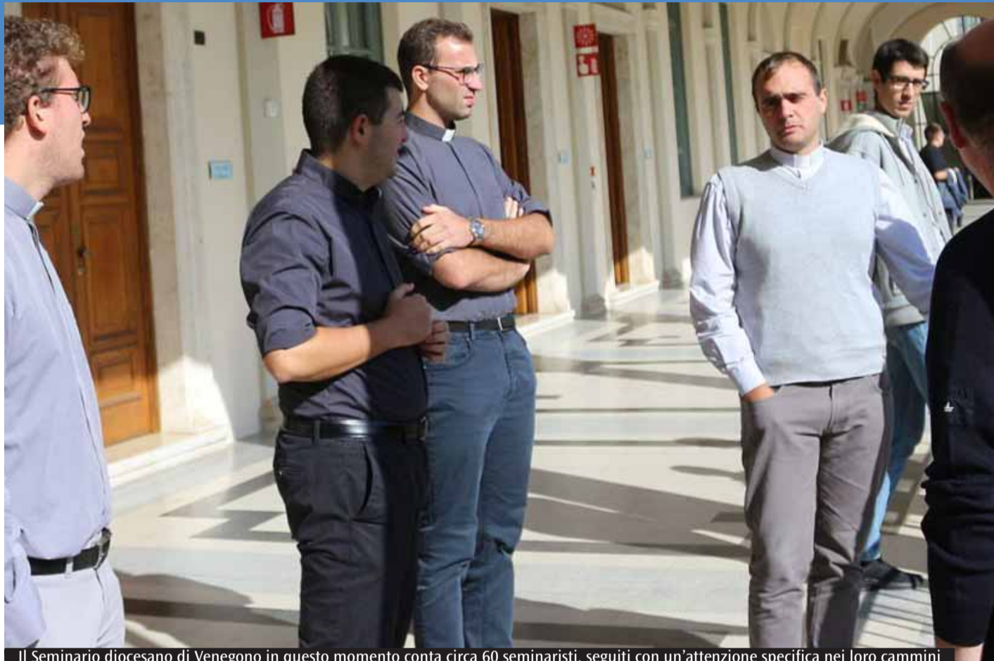
Il Seminario diocesano di Venegono in questo momento conta circa 60 seminaristi, seguiti con un'attenzione specifica nei loro cammini