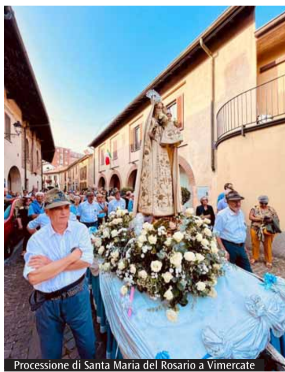
Processione di Santa Maria del Rosario a Vimercate

Prosegue fino al 17 maggio la visita pastorale dell'arcivescovo nel Decanato di Vimercate, nella Zona pastorale V. Come sempre, momenti ricorrenti sono le Messe in ogni chiesa parrocchiale, Rosari, Vespri e visite ai cimiteri. E poi gli incontri con Consigli pastorali, gruppi, associazioni, realtà del territorio come le scuole e famiglie dei ragazzi dell'iniziativa cristiana, la consegna ai nonni della regola di vita e il saluto ai chierichetti.