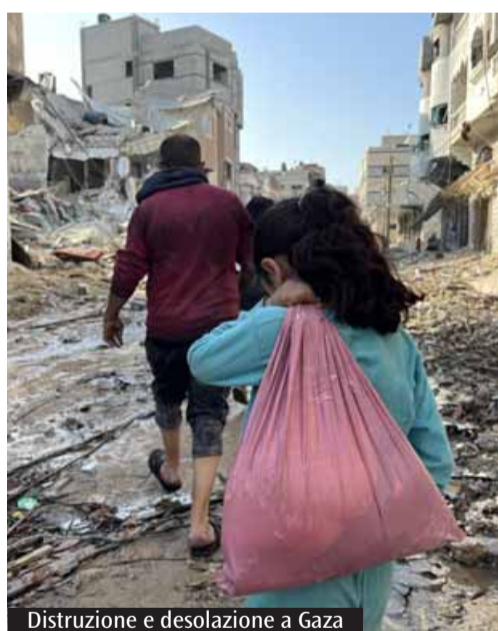
Distruzione e desolazione a Gaza

L a guerra torna regina nella dinamica delle relazioni internazionali. Lo attestano alcuni dati inquietanti. Nel 2025 il numero di conflitti fra Stati è stato il più alto dai tempi della seconda guerra mondiale: ben 59 (fonte: Global Peace Index , ovvero il principale indicatore al mondo per misurare la pace globale, prodotto da Iep - Istituto per l'economia e la pace, autorevole organizzazione globale di ricerca). Sempre l'anno scorso, erano oltre 100 i conflitti armati in corso sul pianeta (lo attesta il centro di ricerca svedese Uppsala Conflict Data Program ): oltre a quelli internazionali, vanno considerati anche i molti e sanguinosi conflitti interni, che coinvolgono anche attori non statali.