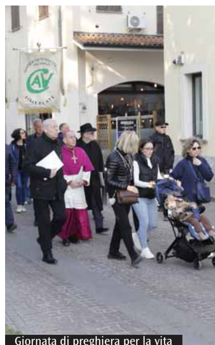
Giornata di preghiera per la vita

ciale, insieme a cui vengono seguiti i casi più complessi, naturalmente in collaborazione con gli enti sul territorio; ma il sostegno arriva, spesso inaspettato anche agli occhi degli stessi volontari, confida Barbato, anche dallo scambio reciproco tra mamme e famiglie, favorito dai momenti di incontro più informale. Felice eccezione rispetto a molti altri Centri analoghi, il Cav di Vimercate può contare sul contributo di oltre 1500 soci. L'impegno, rilancia il presidente, deve essere ora rivolto ai più giovani: spesso curiosi, negli open day a cui anche il Cav partecipa nelle scuole di Vimercate insieme a tutto il mondo del volontariato, ma anche «inconsapevoli», sottolinea, «delle stesse dinamiche biologiche con cui inizia a formarsi una nuova vita». (C.U.)