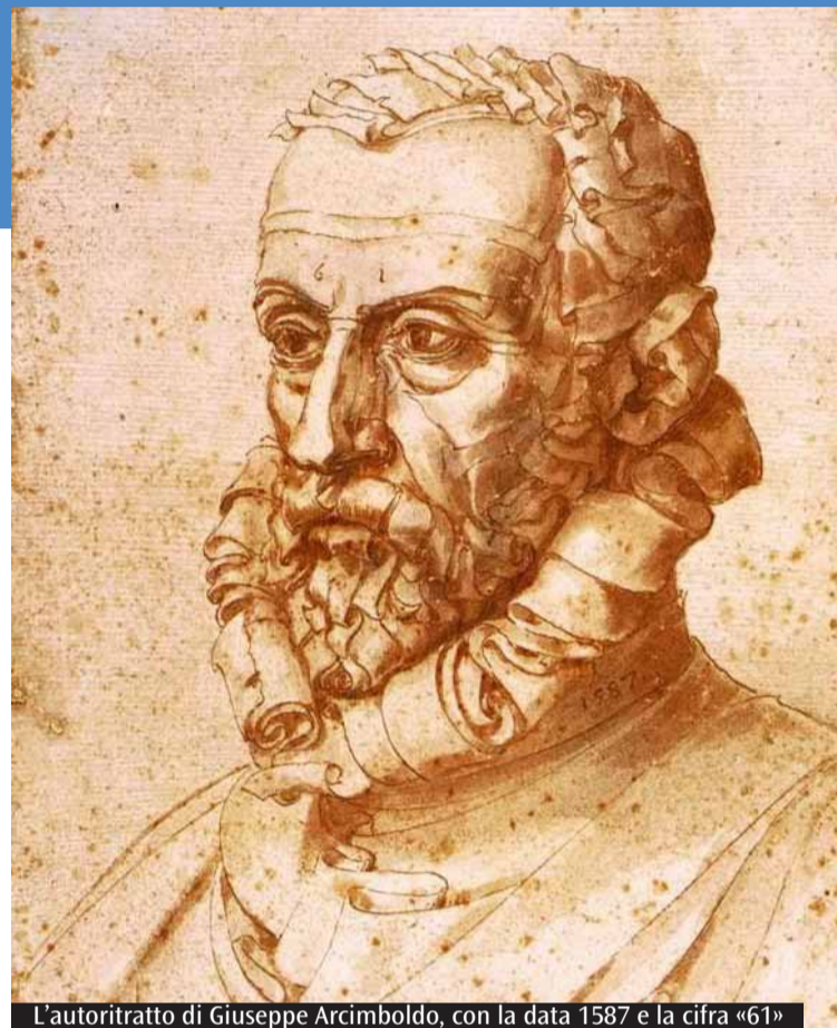
L'autoritratto di Giuseppe Arcimboldo, con la data 1587 e la cifra «61»