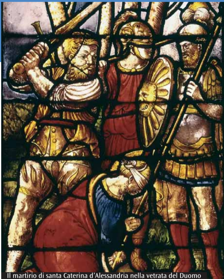
Il martirio di santa Caterina d'Alessandria nella vetrata del Duomo