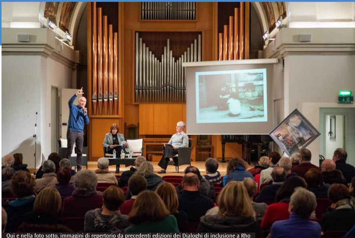
Qui e nella foto sotto, immagini di repertorio da precedenti edizioni dei Dialoghi di inclusione a Rho