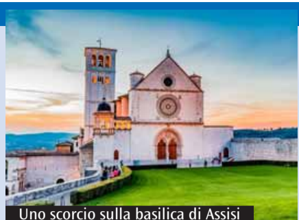
Uno scorcio sulla basilica di Assisi

Non solo fatica fisica, ma anche esperienza di fraternità, condivisione e preghiera. Mettersi in cammino sulle orme di Francesco significa la-