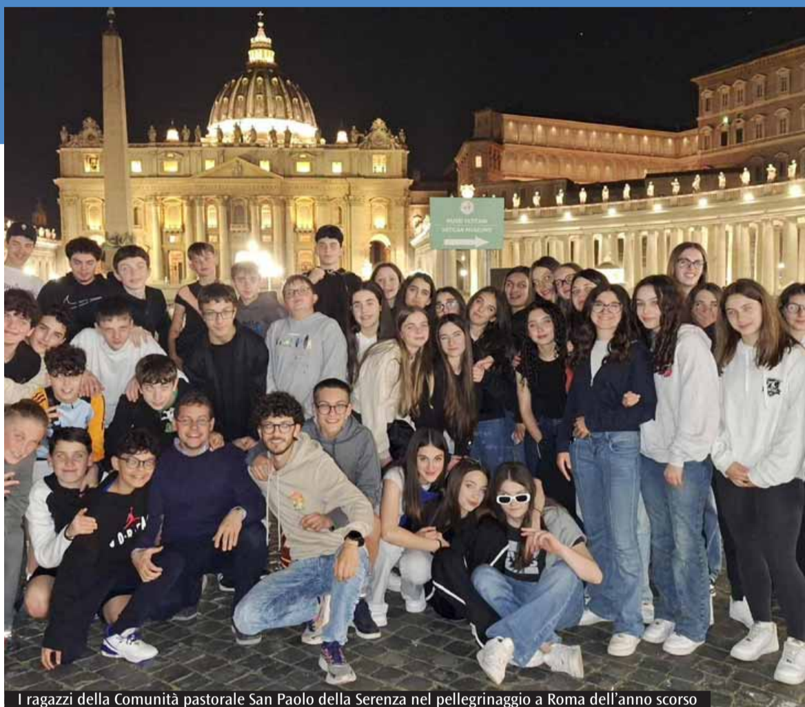
I ragazzi della Comunità pastorale San Paolo della Serenza nel pellegrinaggio a Roma dell'anno scorso

preghiera. Le 12 esperienze imperdibili vengono presentate come un viaggio dentro la vita dei ragazzi. Esperienze innanzitutto da vivere, competenze da maturare, occasioni concrete in cui il Vangelo può incontrare la crescita: amicizie gratuite, organizzazione del tempo, conoscenza del proprio corpo, rilettura del vissuto, dialogo con la Parola di Dio, preghiera personale, Messa, servizio, relazione con la comunità adulta, appartenenza alla famiglia, attenzione al mondo, uscita verso gli altri. Il cammino prende forma proprio a partire da queste esperienze, che aiutano i ragazzi a non separare mai la fede dalla vita quotidiana.