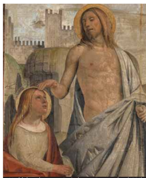
Maddalena incontra Gesù risorto, Bramantino (1500)