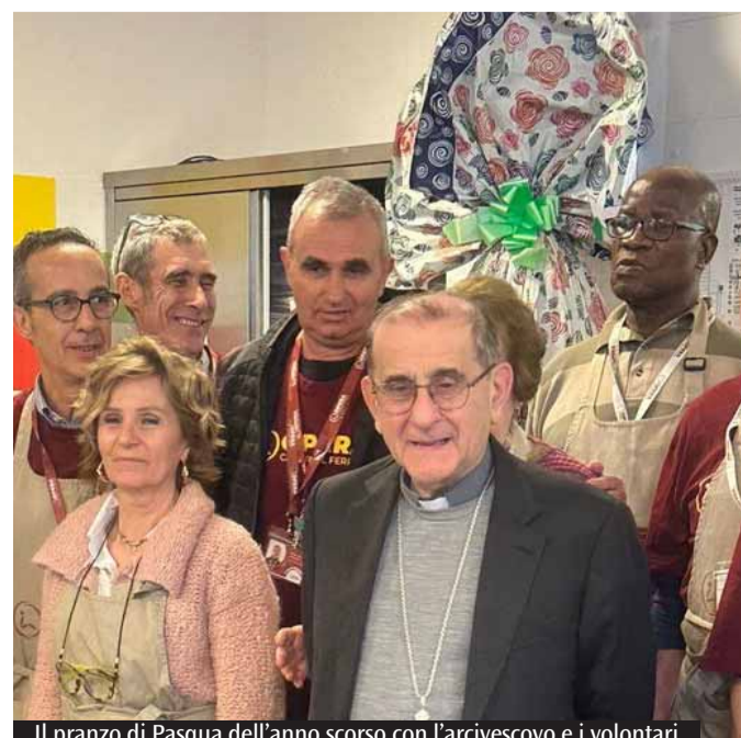
Il pranzo di Pasqua dell'anno scorso con l'arcivescovo e i volontari