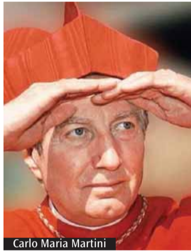
Carlo Maria Martini

La giornata sarà anche un'esperienza di «gemellaggio» con la presenza di un gruppo di Ac di Vicenza