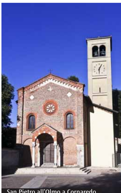
San Pietro all'Olmo a Cornaredo

L'Ordine francescano secolare di Busto Arsizio (Varese), unitamente alla Fraternità dei frati minori della parrocchia del Sacro Cuore, in collaborazione con il Circolo «Laudato si» Busto Arsizio - Gallarate, organizza per domenica 12 aprile alle 15.30 una marcia per la pace nella città di Busto Arsizio, in occasione dell'ottavo centenario della morte di san Francesco. Partenza dal Comune e arrivo alla chiesa del Sacro Cuore dei Frati minori. Sono invitate a partecipare le comunità cristiane del Decanato con i loro parroci, le associazioni di volontariato che operano sul territorio e tutti coloro che hanno a cuore il tema della pace. Info: ofs.bustoarsizio@gmail.com .