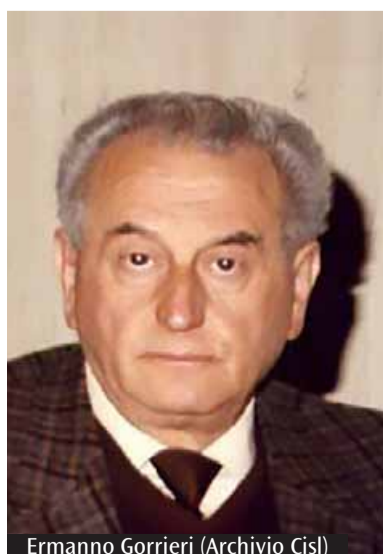
Ermanno Gorrieri

Mercoledì 8 aprile alle ore 18, presso l'auditorium delle Acli milanesi, in via della Signora 3 a Milano, La città dell'uomo aps e la Fondazione Ermanno Gorrieri, in collaborazione con Acli milanesi, Azione cattolica ambrosiana e Rosa Bianca, promuovono la proiezione del docufilm Parti uguali fra disuguali. L'eredità del pensiero di Ermanno Gorrieri .