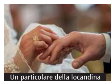
Un particolare della locandina

Domenica 26 aprile pomeriggio con workshop e laboratori pratici pensato per tutti coloro che accompagnano chi si accosta al matrimonio cristiano