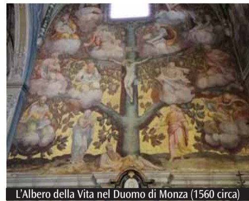
L'Albero della Vita nel Duomo di Monza (1560 circa)

solo negli archivi della Fabbrica. Sappiamo, così, che nel 1551 l'artista dipinse una Madonna presso l'adiacente corte ducale, mentre l'anno successivo eseguì un cartone di tema natalizio. Nel febbraio del 1554, inoltre, l'Arcimboldo ricevette un pagamento per aver dipinto le ante dell'organo appena terminato dall'Antegnati. E nei mesi successivi fu impegnato a decorare palchi e portici, insegnò e apparati scenici in occasioni di solennità religiose: un'abilità, questa, che negli anni seguenti sarà particolarmente apprezzata proprio alla corte imperiale. Ma non solo per il Duomo lavorò Arcimboldo a Milano. Suo, ad esempio, seppur in collaborazione con Giuseppe Meda, è il disegno del monumentale e prezioso gonfalone civico con l'immagine del patrono Ambrogio, oggi conservato nelle raccolte del Castello sforzesco, che si era fatto conoscere e apprezzare come uno degli artisti lombardi più talentuosi. Gli anni asburgici furono poi ricchi di soddisfazioni e riconoscimenti, con il nostro pittore messo nelle condizioni di dare vita alle sue visionarie creazioni, acclamato come un novello Leonardo. Ma Giuseppe non pensò mai a un trasferimento definitivo, nonostante l'imperatore Rodolfo lo volesse trattenere presso di sé. Milano era la sua patria e a Milano volle tornare, anche per esservi sepolto: nel 1593, a circa 66 anni, appunto.