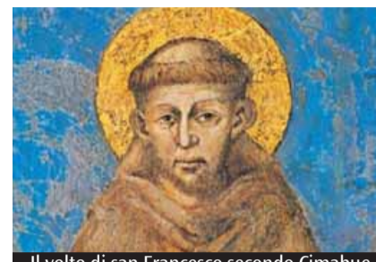
Il volto di san Francesco secondo Cimabue

Il percorso si apre sul desiderio di felicità che abita ogni giovane, raccontando un Francesco inquieto, alla ricerca di senso, tra sogni di gloria e bisogno di riconoscimento. Non una conversione improvvisa, ma un cammino fatto di tentativi, cadute e ripartenze: la prigionia, la malattia, le difficoltà si trasformano in «benedizioni» per maturare consapevo-