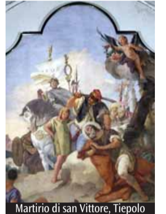
Martirio di san Vittore, Tiepolo