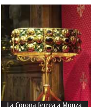
La Corona ferrea a Monza

In programma giovedì alle 18.15, presso l'Auditorium San Fedele o in diretta online