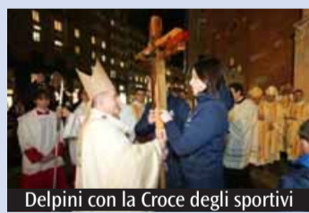
Delpini con la Croce degli sportivi

D urante il Pellegrinaggio diocesano dei preadolescenti, e in particolare in occasione dell'Udienza generale di mercoledì 8 aprile, la Diocesi e la Fom riconsegneranno ufficialmente a Leone XIV la Croce degli sportivi, che durante le