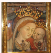
Tavola: cm 24x32

"Icona della Madonna del Buon Consiglio"