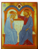
Tavola: cm 35x45 (29.5x38.5 interno, oppure liscia senza culla)

* Per il livello Proficienti, Medio e Avanzato è richiesta l'autonomia in merito a: tavola, pennelli, oro, vernici, colori, ecc.