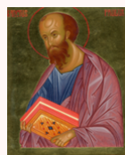
Tavola: cm 30x40 (25x34 interno)