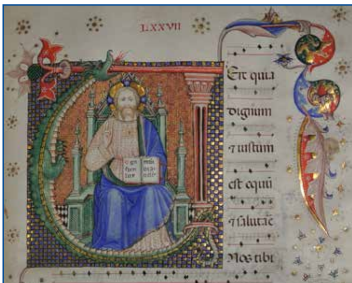
Milano, Biblioteca del Capitolo Metropolitano: Messale detto di Santa Tecla (miniatura, 1402)

La verità raramente è pura, e mai semplice. (Oscar Wilde)