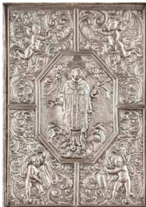
Milano, Duomo: Scurolo di San Carlo Borromeo (part.)