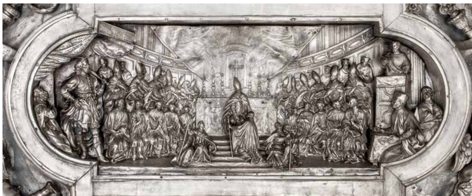
Milano, Duomo: Scurolo di San Carlo Borromeo (part.)

Info Point: tel. 02.72023375 - info@duomomilano.it