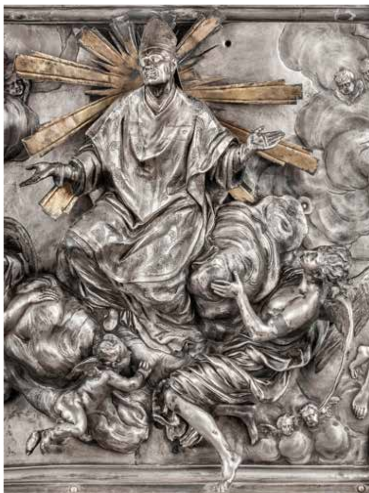
Milano, Duomo: Scurolo di San Carlo (part.)

Il completo rifacimento dell'impianto di illuminazione, su progetto di Pietro Palladino, ha infine restituito piena luminosità ai tesori della cappella, troppo a lungo nascosti dalla patina del tempo.