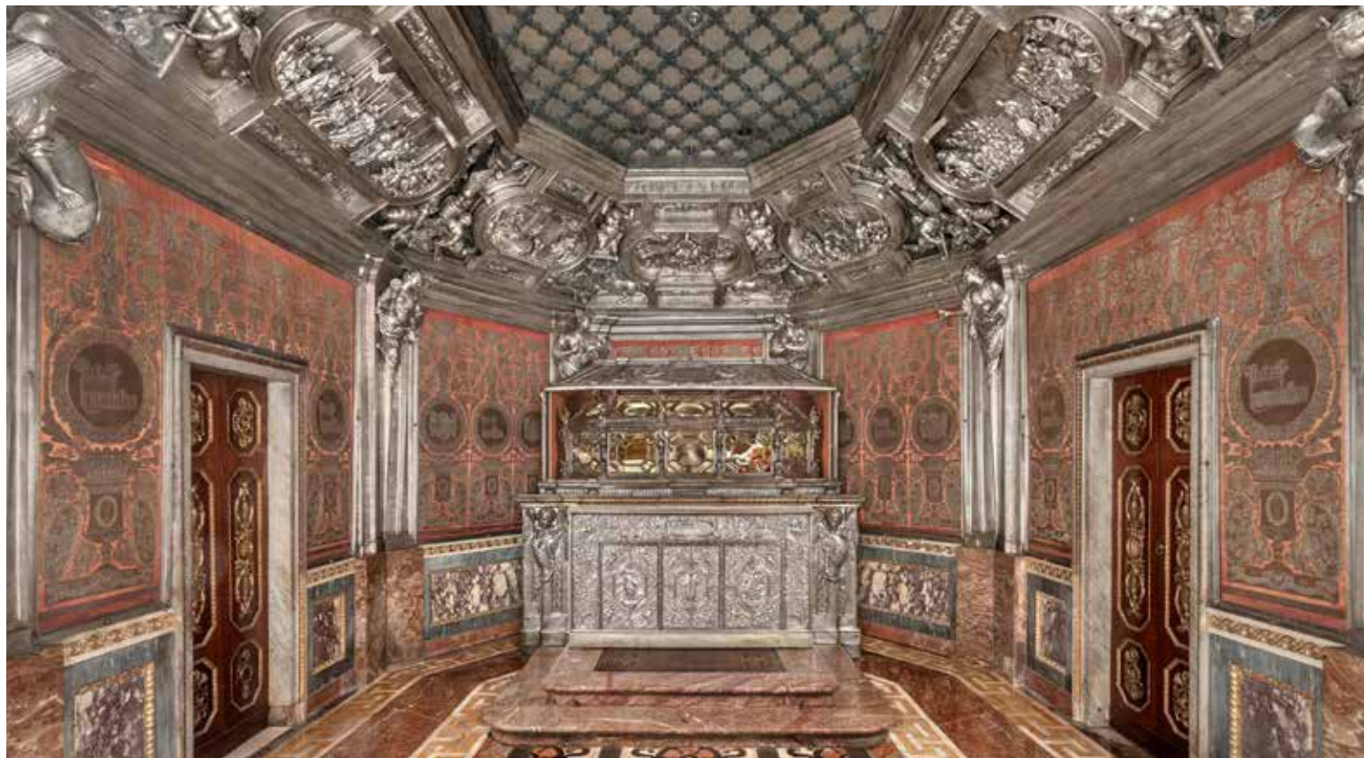
Milano, Duomo: veduta dello Scurolo di San Carlo Borromeo

D opo due anni, si è concluso il restauro dello Scurolo di San Carlo , tornato finalmente accessibile a fedeli e visitatori. Collocato al di sotto del presbiterio del Duomo, è stato progettato per accogliere le spoglie mortali di san Carlo Borromeo e il suo nome deriva dal termine dialettale scoureu , ovvero “luogo sotterraneo”: si tratta di un ambiente suggestivo, che può essere considerato “il cuore del Duomo”. La conclusione del restauro è stata presentata all’arcivescovo monsignor Mario Delpini, al termine del Pontificale del 3 novembre scorso, e quindi in una serata (venerdì 10 novembre) con gli interventi dell’arciprete monsignor Gianantonio Borgonovo, del direttore dei cantieri della Veneranda Fabbrica del Duomo Francesco Canali e del funzionario della Soprintendenza Archeologia, Belle Arti e Paesaggio per la Città di Milano Laura Paola Gnaccolini, moderati dalla coordinatrice dell’ Area Cultura e Conservazione della Veneranda Fabbrica Elisa Mantia.