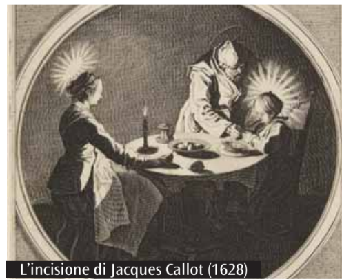
L'incisione di Jacques Callot (1628)

sonale e il ristoro spirituale dei pastori della Chiesa ambrosiana. La tela, tuttavia, è giunta nella Curia milanese soltanto in epoca napoleonica, come deposito della Pinacoteca di Brera, dopo essere stata requisita agli inizi dell'Ottocento nel convento dei cappuccini di Concordia sulla Secchia, nel modenese. La provenienza emiliana ben si accorda con lo stile dell'opera, che è databile alla prima metà del Seicento e che può essere attribuita alla scuola bolognese. Nulla si sa, invece, riguardo all'autore. Il soggetto «intimistico» in passato aveva fatto pensare a una mano femminile, come quella della brava pittrice felsinea Elisabetta Sirani. Studi più recenti, però, hanno rilevato affinità con la pittura di Guido Reni, uno dei più grandi artisti del XVII secolo, a capo di un'ampia bottega dove lavoravano pittori italiani e stranieri. Come il francese Pierre Laurier, ad esempio, che potrebbe essere proprio l'artefice di questo dipinto, che presenta effettivamente accenti decorativi di gusto transalpino.