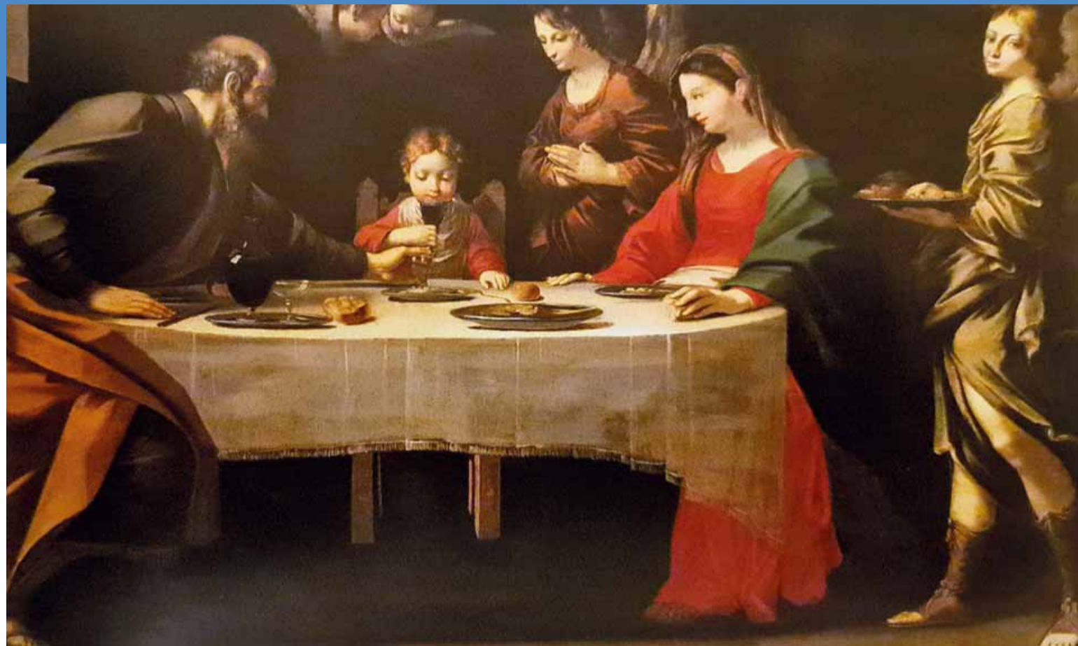
La Sacra Famiglia a tavola, scuola di Guido Reni (1630 circa), Milano, Quadreria arcivescovile