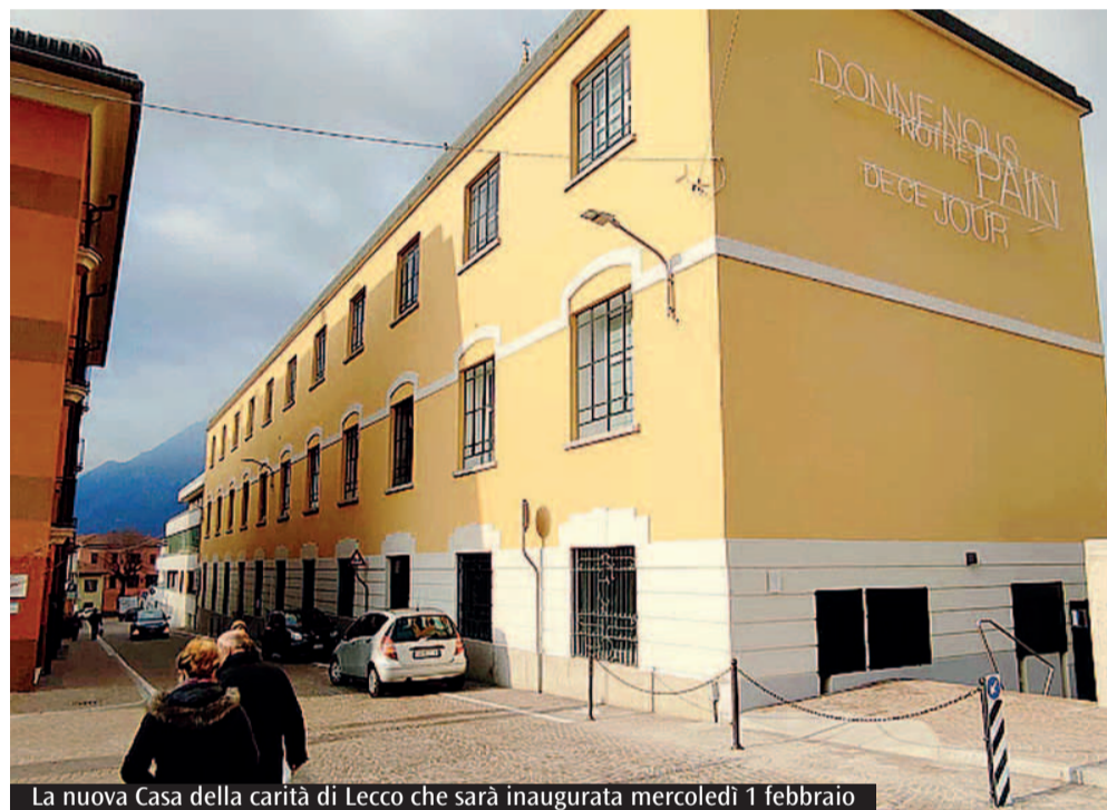
La nuova Casa della carità di Lecco che sarà inaugurata mercoledì 1 febbraio