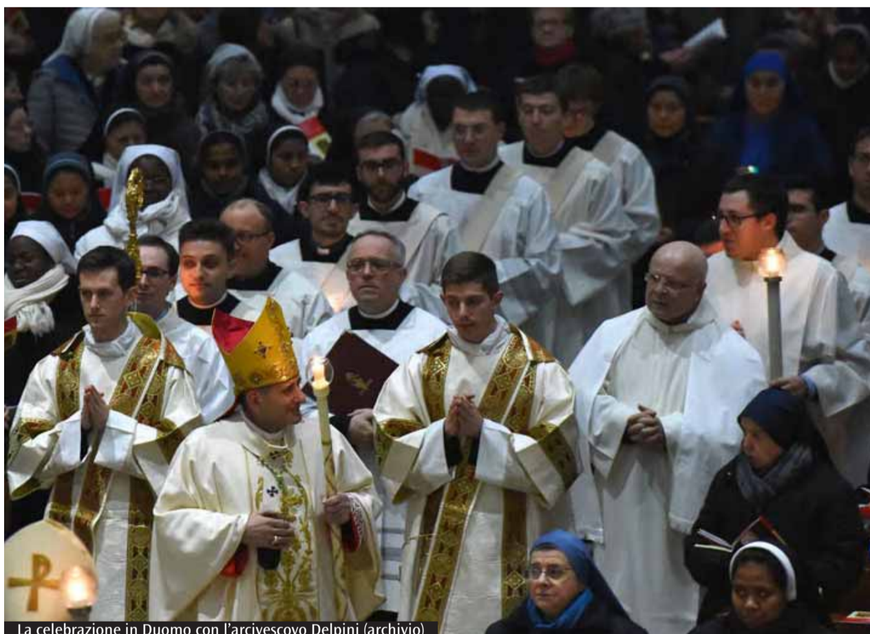
La celebrazione in Duomo con l'arcivescovo Delpini

Un appuntamento annuale nel quale l'intera Diocesi vuole rendere grazie per il dono di tante espressioni di Vita consacrata. Religiosi e religiose che continuano a voler trasmettere la bellezza della vocazione cristiana, nei tratti dell'umanità di Gesù casto, povero