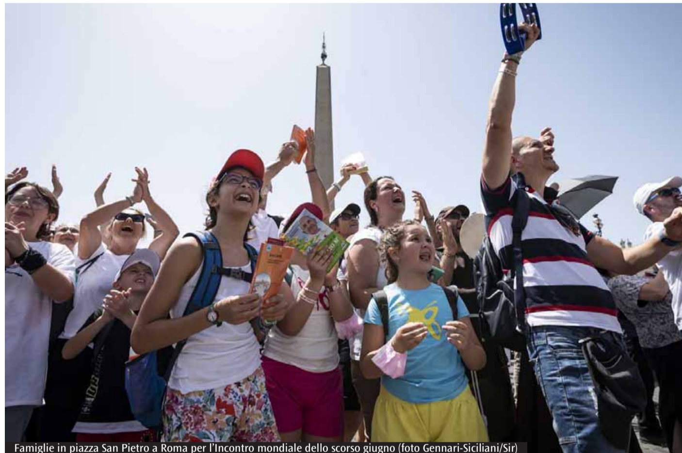
Famiglie in piazza San Pietro a Roma per l'Incontro mondiale dello scorso giugno

Riscoprire lo slancio missionario dell'essere famiglia non richiede particolare specializzazione, si radica piuttosto nel rapporto semplice, concreto e fecondo con il Signore: «Donare speranza a coloro che non ne hanno. Agite come se tutto dipendesse da voi, sapendo che tutto va affida-