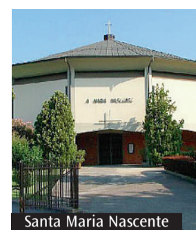
Santa Maria Nascente

L a chiesa di Santa Maria Nascente al QT8 a Milano è stata interessata, negli scorsi mesi, da importanti lavori di bonifica e restauro che hanno costretto alla chiusura della stessa per diverso tempo. Ora dal prossimo 8 dicembre, solennità dell'Immacolata Concezione della