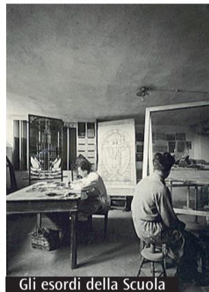
Gli esordi della Scuola

In occasione del centenario della scuola milanese di arti per la liturgia, dal 10 dicembre al 16 gennaio la Fondazione Stelline a Milano (corso Magenta, 61) ospita la mostra «La bellezza del sacro. Milano e la Scuola Beato Angelico 1921-2021». All'inaugurazione di giovedì 9 alle 11 parteciperà anche l'arcivescovo, mons. Delpini. Attingendo alla straordinaria ricchezza dell'archivio fotografico della Scuola Beato Angelico, il percorso espositivo della mostra offre una narrazione che attraverso 40 fotografie e testi descrittivi, affronta il ruolo di sviluppo del rapporto tra la Scuola e il contesto civile ed ecclesiale. In particolare vuole offrire ai visitatori una panoramica sugli aspetti che in un secolo hanno legato indissolubilmente l'istituzione alla città che la accoglie. La mostra vuole, infatti, riflettere e porre in luce il contributo offerto dalla Scuola Beato Angelico durante questo suo secolo di vita, in particolare alla città di Milano e al territorio lombardo, indicando al contempo le linee per una sua rinnovata presenza nell'attuale contesto cittadino e internazionale. La mostra è realizzata dalla Scuola Beato Angelico in collaborazione con la Fondazione Stelline, con il contributo di Regione Lombardia e il patrocinio del Comune di Milano. Ingresso gratuito, tutti i giorni dalle 9 alle 20. Info: www.stelline.it .