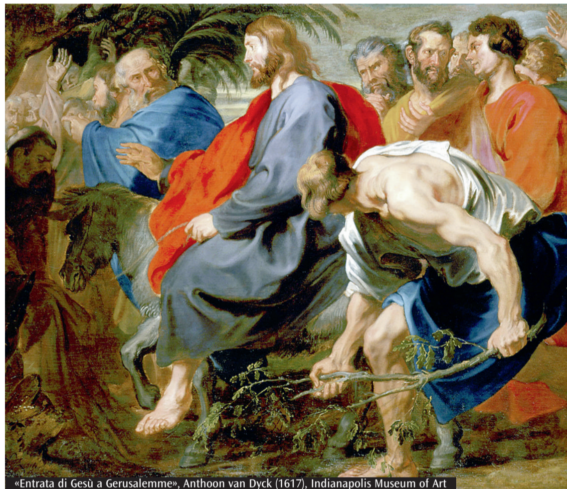
«Entrata di Gesù a Gerusalemme», Anthon van Dyck (1617), Indianapolis Museum of Art