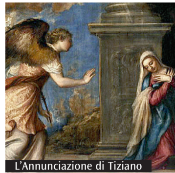
L'Annunciazione di Tiziano

time e i mesi passano senza che riusciamo davvero a goderne. Allora ben venga un momento di sosta fatto di musica, arte e parole. L'incontro si terrà lunedì 13 dicembre alle 18 presso il Centro Asteria di Milano (piazzale Carrara, 17). Sarebbe bello che, nei limiti del possi-