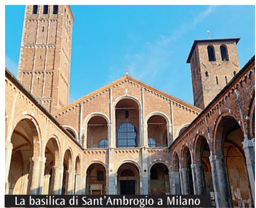
La basilica di Sant'Ambrogio a Milano