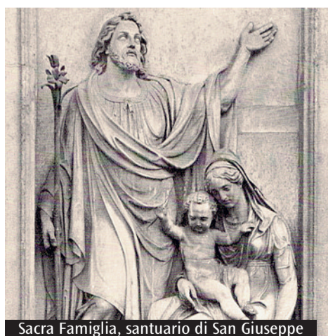
Sacra Famiglia, santuario di San Giuseppe

«Un tema che mi sta particolarmente a cuore è dare significato alla parola ripartenza. Un modo è farlo venendo incontro alle persone fragili, perché il momento presente ci mette di fronte a più gravose povertà».