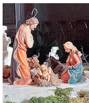
Una tradizione lunga 25 anni: sarà visitabile dall'Immacolata fino al 23 gennaio