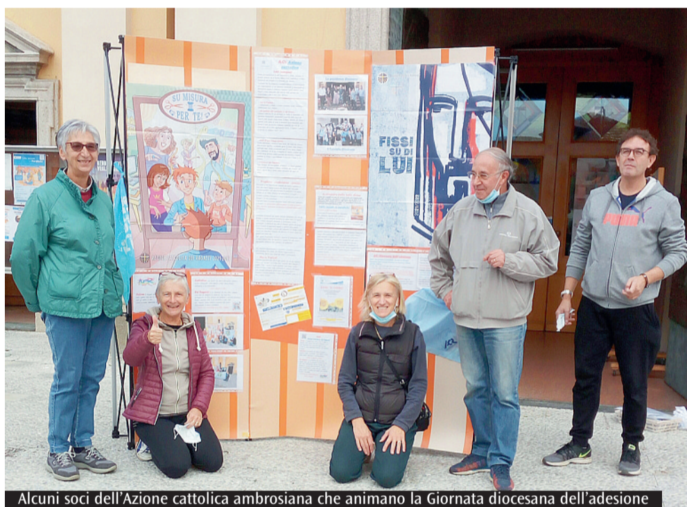
Alcuni soci dell'Azione cattolica ambrosiana che animano la Giornata diocesana dell'adesione

Per la celebrazione della Giornata dell'adesione, il Centro diocesano di Ac ha predisposto una traccia di celebrazione che si potrà inserire nelle Messe parrocchiali in occasione della consegna delle tessere ai soci. Diversi gruppi hanno poi organizzato iniziative per far conoscere l'associazione e per diffondere i sussidi e le pubblicazioni. «Scegliamo di essere testimoni di Gesù risorto "insieme", come associazione, convinti che andando per le strade del mondo "a due a due" si annuncia meglio la Parola e stando riuniti nel suo nome - anche solo in "due o tre" - si offre a Dio lo spazio per abitare la storia degli uomini».