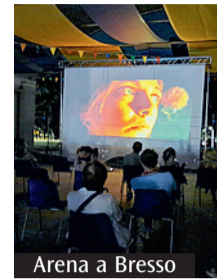
Arena a Bresso

Free Guys . Eroe per gioco in cui il protagonista scopre di essere un personaggio secondario di un videogioco e si mette alla ricerca dei creatori. Il cinema italiano proporrà ad agosto inoltrato