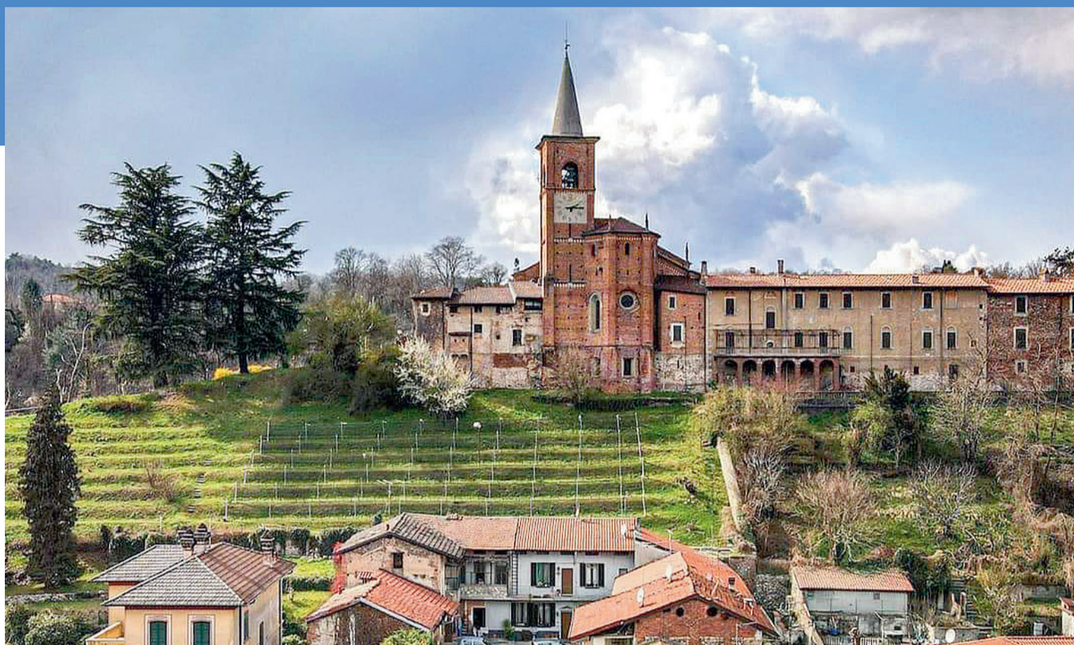
Una bella veduta della Collegiata che domina il borgo di Castiglione Olona (Va)