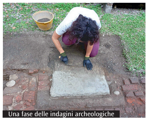
Una fase delle indagini archeologiche