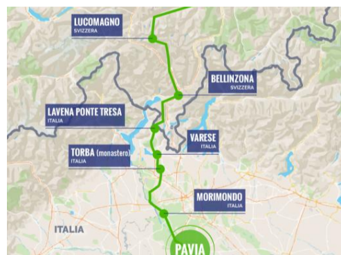
Il percorso della Via Franciscana di Lucomagno

rale, insieme a luoghi che da sempre sono punti di riferimento religiosi e spirituali. Anche da una rapida occhiata alla cartina, infatti, ci si rende conto di come questo cammino vada a intercettare posti come la millenaria badia di San Geminio a Ganna, lo straordinario complesso del Sacro Monte di Varese (patrimonio dell'Unesco), l'incantevole Villa Cagnola a Gazzada (con la sua preziosa raccolta d'arte), gli importantissimi siti archeologici di Castelsepio e di Torba, il borgo rinascimentale di Castiglione Olona con tutti i suoi tesori (che Gabriele D'Annunzio celebrò come «l'isola di Toscana in Lombardia»), il suggestivo monastero di Cairate. Proseguendo lungo Via Franciscana, inoltre, si può andare alla scoperta dell'affascinante abitato di Cuggiono, della sorprendente canonica di Bernate Ticino, delle chiese e delle «ville di delizia» che si affacciano sul Naviglio a Robecco, della mirabile abbazia di Morimondo (prima fondazione cistercense in Lombardia). Fino a concludere il pellegrinaggio sul-