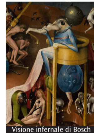
Visione infernale di Bosch

Nessuno ha saputo descrivere l'Inferno come Dante. Ma nessuno ha saputo «illustrarlo» come Hieronymus Bosch. Martedì 15 giugno, alle ore 18.30, nel Chiostro del Museo diocesano a Milano (corso di Porta Ticinese, 95) si terrà il secondo appuntamento del ciclo «Aperitivo con l'arte», proposto in occasione del settimo centenario della morte dell'Alighieri: Luca Frigerio, giornalista e scrittore, racconterà infatti, dettaglio dopo dettaglio, le infernali visioni di Bosch, autentico «Dante» del pennello nel nord Europa. La conferenza - in presenza, all'aperto e nel rispetto delle norme in vigore - è gratuita, ma è previsto un ingresso di 12 euro che comprende una prima consumazione al Bistrot e la visita alle due mostre in corso al Museo diocesano: quella sugli affreschi del monastero di Santa Chiara e quella dedicata al fotografo Jacques Henri Lartigue. In alternativa è possibile partecipare all'incontro anche online, sulla piattaforma Zoom, al costo di 10 euro (acquisto tramite biglietteria elettronica su www.chiostri-sanctiustorgio.it , dove si possono trovare ulteriori informazioni).