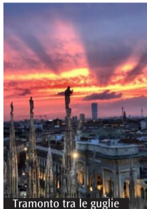
Tramonto tra le guglie

Ogni giovedì, nella stagione in cui i colori del tramonto tingono d'incanto il marmo di Candoglia, i visitatori del Duomo di Milano possono godere dell'opportunità di salire sulle Terrazze, con l'ascensore, fino alle ore 22 (l'ultima salita è prevista alle ore 21.10; biglietti a partire da 14 euro, 7 euro ridotti). Un'esperienza per scoprire suggestivi scorci e insolite prospettive sulla città, nell'osservanza di tutte le norme sanitarie vigenti, con la possibilità di ammirare al tramonto le 135 guglie, la statuarìa, la Madonna e tutte quelle preziosità architettoniche che fanno del Duomo la gemma più splendente dell'arte gotica. Per celebrare la riapertura serale, l'impianto di illuminazione di gala del Duomo sarà eccezionalmente attivato anche nella serata del giovedì. Nel fine settimana, sempre sulle Terrazze, proseguono gli appuntamenti con la «Passeggiata tra le guglie»: un percorso guidato di un'ora per viaggiare attraverso la storia e la bellezza del Duomo di Milano. Fino al 30 giugno, è possibile usufruire di una promozione con uno sconto del 20 per cento. Tutte le informazioni su www.duomomilano.it .