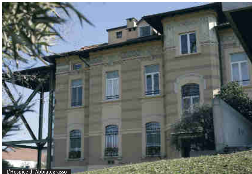
L'Hospice di Abbiategrasso