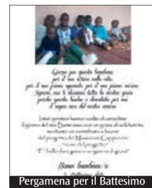
Pergamene per il Battesimo