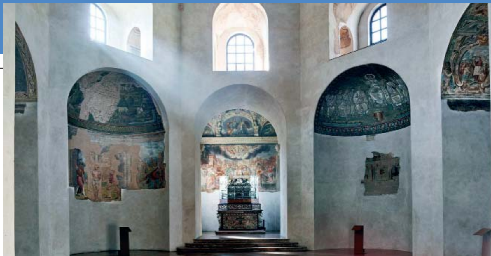
L'interno della Cappella di Sant'Aquilino nella basilica di San Lorenzo a Milano. Sotto, particolare del mosaico con il Cristo legislatore (V secolo).

A Milano, la libreria del Centro Pime (Pontificio istituto missioni estere) in via Monte Rosa 81, pur mantenendo una sua specializzazione in temi religiosi, si è aperta maggiormente alle altre edizioni, fra cui narrativa e saggistica. Il negozio è anche un importante punto di riferimento per l'editoria scolastica. Alla Libreria Pime è possibile anche prenotare i testi per il nuovo anno scolastico delle scuole di ogni ordine e grado. Non a caso, di recente, è scelta come libreria di appoggio per i testi didattici da due tra le più importanti scuole cattoliche milanesi ed è «libreria amica» di Edizioni Centro Studi Erickson di Trento, casa editrice e centro di formazione che si occupa principalmente di educazione, psicologia, didattica, lavoro sociale e welfare. Una volta consegnata di persona o inviata via e-mail a negoziopime@pimemilano.com la propria lista di volumi si potranno monitorare in tempo reale l'arrivo dei libri in un'apposita sezione del sito internet https://negoziopime.pimemilano.com/ . Come tutti i servizi offerti dal Centro Pime anche in questo caso i preventivi vanno a sostenere le opere dei missionari del Pime nel mondo senza alcun sovrapprezzo per l'utente.