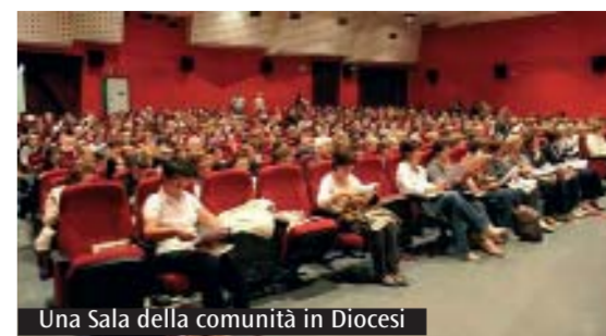
Una Sala della comunità in Diocesi

a 10 mila euro per il costo dei progetti presentati sulla linea A («Progetti relativi a sale che svolgono attività di spettacolo già attive»); ammissibilità delle spese derivanti dalle disposizioni normative e dai protocolli in materia di sicurezza a seguito dell'emergenza Covid-19, nonché delle spese finalizzate all'acquisto di attrezzature destinate alla realizzazione di attività di spettacolo utilizzate al di fuori della sala stessa (esempio, arene estive e drive-in). Naturalmente è possibile modificare le domande già protocollate. In sede di presentazione del bando, don Gianluca Bernardini, presidente Acc di Milano e referente per il cinema e il teatro della Diocesi, aveva commentato: «Accogliamo con