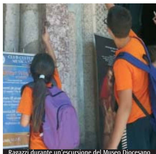
Ragazzi durante un'escursione del Museo Diocesano

Una settimana di avventure, giochi e laboratori artistici per bambini e ragazzi dai 5 ai 12 anni al Museo Diocesano a Milano (piazza Sant'Eustorgio, 3). Le attività verranno svolte dal 7 all'11 settembre da personale qualificato nel rispetto delle norme di sicurezza Covid-19 con un massimo di sette iscritti per animatore in presenza. I piccoli partecipanti saranno condotti in visita alla mostra della fotografa Inge Morath e a quella dedicata a «Gauguin - Matisse - Chagall». La passione nell'arte francese dai Musei Vaticani, alle altre opere presenti nel Museo Diocesano, al suo chiostro e al contesto storico che lo circonda, con una vera e propria passeggiata nel