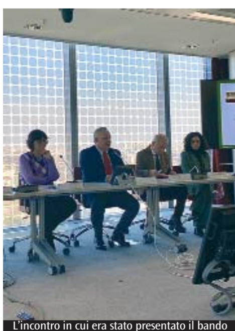
L'incontro in cui era stato presentato il bando

« P regare è quel salto di qualità con cui ci abbandoniamo a Dio e usciamo dallo strettoio e dalle costrizioni dell'ordinarietà e facciamo allora scelte libere». Per fare quel «salto di qualità» contenuto in queste parole del cardinale Carlo Maria Martini viene riproposto il volume Il desiderio di Dio. Pregare con i Salmi (Centro ambrosiano, 208 pagine, 17 euro, disponibile anche in versione Kindle a 9,99 euro). Proprio il cardinale Martini in questo volume suggeriva di prendere un Salmo facile, magari di lamentazione. Leggerlo attentamente, con calma e in atmosfera di silenzio. Poi prendere qualche parola o qualche versetto del Salmo che ci ha colpito e restare un po' più a lungo su di esso. In questi giorni a casa, questo è un metodo «facile» da sperimentare.