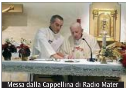
Messa dalla Cappellina di Radio Mater

R adio Mater in questo momento di emergenza internazionale per il coronavirus invita tutti gli ascoltatori a pregare ancora più intensamente e per questo arricchisce il proprio palinsesto di numerosi appuntamenti religiosi e spirituali. In questo periodo quaresimale le Messe quotidiane in diretta diventano quattro. Alle 7 del mattino collegamento Facebook per la Messa di papa Francesco da Santa Marta. Alle 7.30 diretta dal Santuario della Santa Casa di Loreto (lunedì e martedì), dal Carmelo di Monza (mercoledì, giovedì e venerdì), dal Sacro