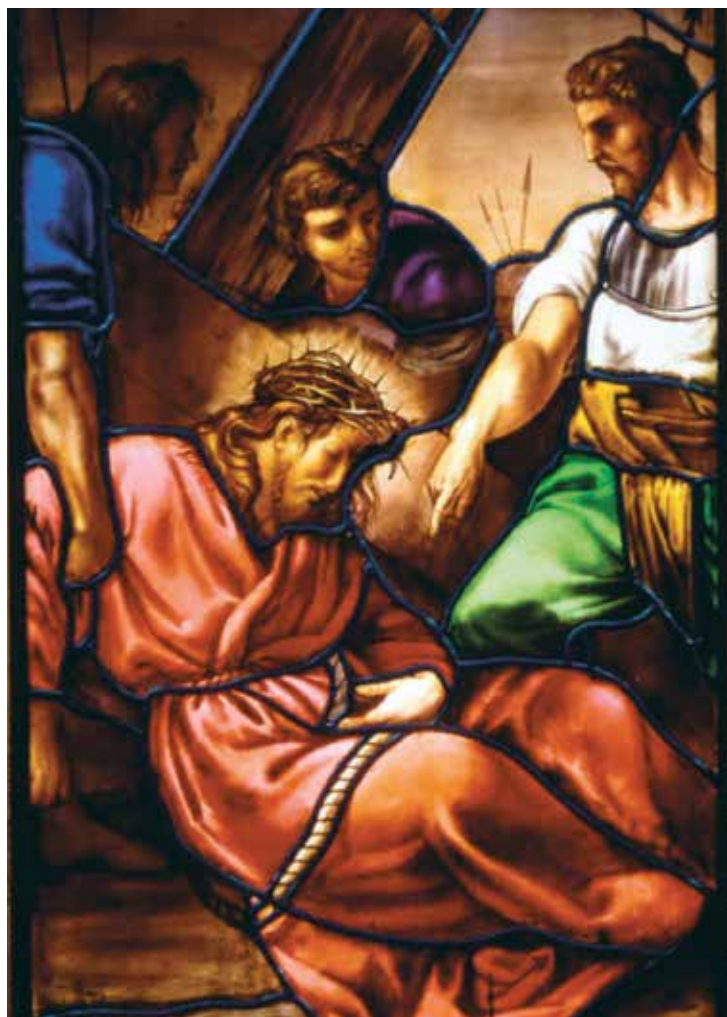
Milano, Duomo: Gesù cade sotto il peso della croce (vetrata, XIX sec., part.)