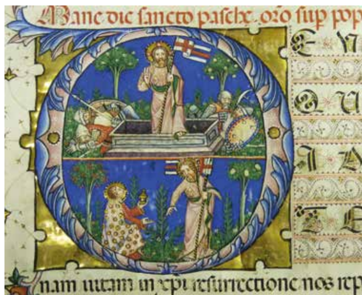
Milano, Biblioteca del Capitolo Metropolitano: L'incontro del Risorto con Maria di Màgdala nel giardino, Messale detto di Santa Tecla (miniatura, 1402, part.)

Dove il cantus firmus è chiaro e distinto, il contrappunto può dispiegarsi col massimo vigore. Per parlare con il Calcedonese, l'uno e l'altro sono «divisi eppure indistinti», come lo sono in Cristo la natura divina e la natura umana». (D. BONHOEFFER, Resistenza e resa )