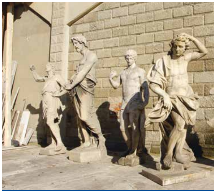
Milano, Cantiere Marmisti: alcune delle statue scelte per il progetto Adotta una Statua