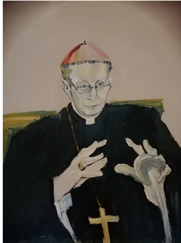
Opera di Wanda Guanella . Il Cardinal Martini "plasma" la Parola Fondazione Ambrosianeum, Milano

CM Martini, Cento parole di comunione, 1987