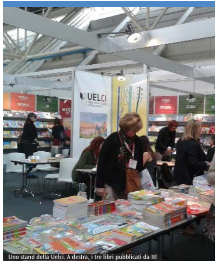
Uno stand della Uelci. A destra, i tre libri pubblicati da Itl