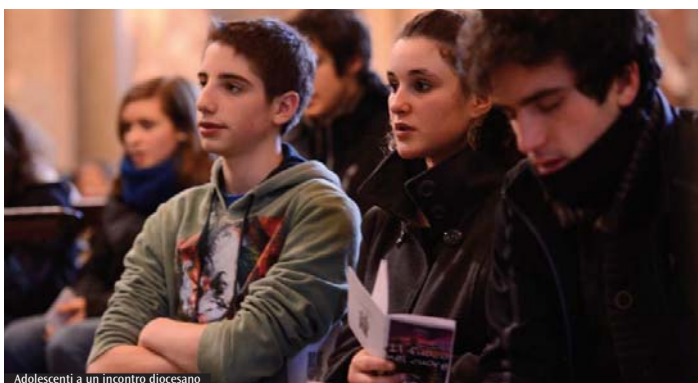
Adolescenti a un incontro diocesano

telefono al numero 02.58391355 oppure personalmente presso la Fom (Fondazione diocesana per gli oratori milanesi) e Servizio oratorio e sport (via Sant'Antonio, 5 - Milano), da lunedì a venerdì (ore 9-13; 14-17). Si raccolgono le iscrizioni fino ad esaurimento posti. Si raccomanda di segnalare il numero effettivo di adolescenti ed educatori, senza occupare posti in eccesso, per permettere la partecipazione di altri gruppi che ne fanno richiesta. È possibile anticipare il momento di ritiro con un'esperienza di fraternità intensa, a cura dell'Azione cattolica (vedi box a fianco), che propone agli adolescenti di ritirati dal pomeriggio di sabato 24 febbraio. Chi intende partecipare sia il sabato sia la domenica dovrà iscriversi esclusivamente seguendo le indicazioni dell'Ac.