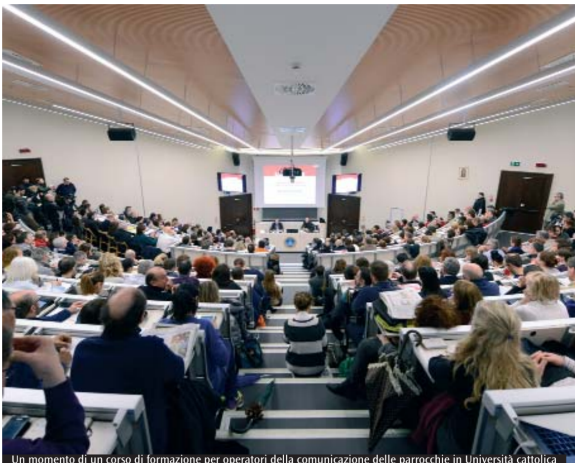
Un momento di un corso di formazione per operatori della comunicazione delle parrocchie in Università cattolica

* Responsabile Ufficio per le comunicazioni sociali della Diocesi