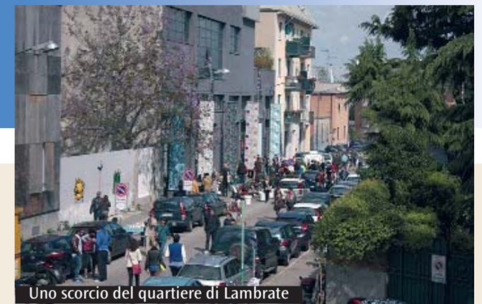
Uno scorcio del quartiere di Lambrate

Prima e dopo la visita pastorale è possibile inviare domande e riflessioni all'Arcivescovo scrivendo a visitascola@diocesi.milano.it . Gli incontri di San Giuliano Milanese e Milano saranno seguiti in diretta Twitter attraverso l'hashtag #visitascola. Nei giorni successivi i video delle serate saranno online su www.chiesadimilano.it . Chiesa Tv (canale 195 del digitale terrestre) trasmetterà due «speciali»: quello sull'incontro con il Decanato San Donato Milanese andrà in onda sabato 18 febbraio alle 19.30 e domenica 19 febbraio alle 20.45, quello sull'incontro coi Decanati Città Studi e Lambrate andrà in onda lunedì 20 febbraio alle 21.10 e martedì 21 febbraio alle 18.30.