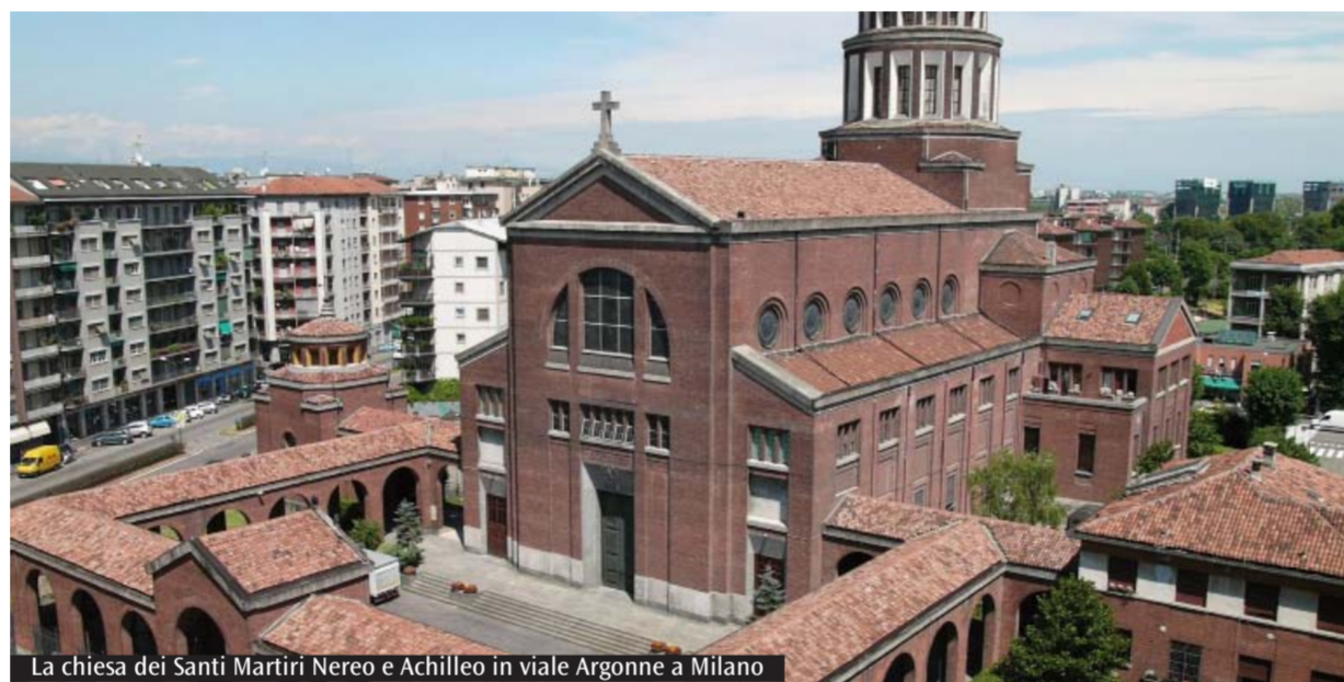
La chiesa dei Santi Martiri Nereo e Achilleo in viale Argonne a Milano

«Il nostro non è un Decanato grandissimo. La visita del Cardinale è un'occasione per interrogarsi su come lavorare insieme e per individuare nel nostro contesto le sfide proposte dall'Arcivescovo. Qui da noi ci sono molti studenti, abbiamo di fronte una sfida culturale, dobbiamo essere una Chiesa che esce e che va incontro a una realtà plurale. Vorremmo dare qualcosa di più, da questo punto di vista, anche a livello di Decanato. C'è poi il discorso sulla famiglia come soggetto di evangelizzazione, una prospettiva recepita da tutte le parrocchie. Sul nostro territorio ci sono inoltre diversi ospedali in cui vengono a curarsi persone provenienti da tutta Italia e alcune realtà associative che si prendono cura dei familiari che accompagnano a Milano i loro cari sofferenti. In questo contesto si coniugano l'attenzione alla famiglia e la necessità, appunto, di essere "Chiesa in uscita". Le nostre parrocchie devono accogliere non solo chi viene abitualmente in chiesa, ma