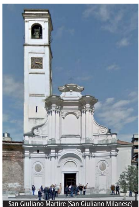
San Giuliano Martire (San Giuliano Milanese)

«Bisogna distinguere tra gli immigrati presenti da qualche decennio, come i filippini e i latino-americani, i più numerosi, con i quali l'integrazione è buona, e coloro che sono giunti da noi in tempi recenti e che sono ancora in cerca di una sistemazione dignitosa. Sia per l'integrazione dei cristiani, in particolare sul fronte della vita ecclesiale, sia delle persone di altre fedi sono in atto esperienze di accoglienza».