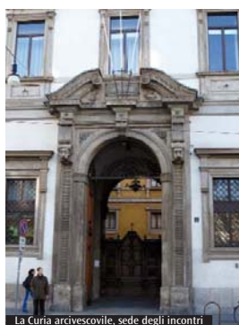
La Curia archiepiscopale, sede degli incontri