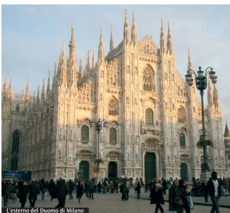
L'esterno del Duomo di Milano