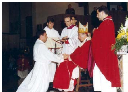
4 ottobre 1998: da Rettore del Quadriennio teologico durante le ordinazioni diaconali nella chiesa di San Bernardo presiedute dal cardinale Martini