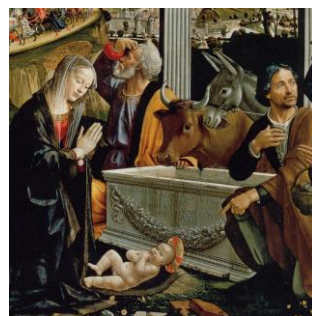
Foto: Domenico Ghirlandaio Natività

L'asino, il bue, la pecora, il cane, ma anche il cammello e il pavone ... Un emozionante viaggio tra arte, fede, alla scoperta Di simbologie e citazioni bibliche.