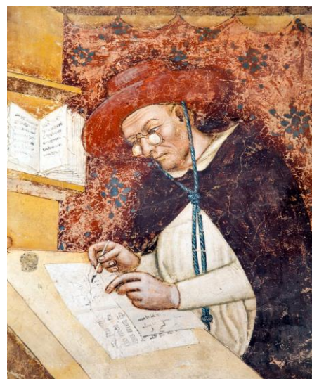
Foto: Tommaso da Modena, ritratto del Cardinale Ugo da Provenza

Ma quando è il diavolo a portare gli occhiali?