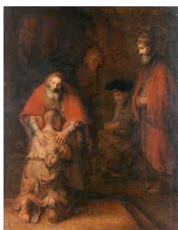
Foto: Rembrandt Figliol Prodigio