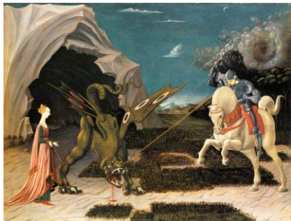
Foto: Paolo Uccello San Giorgio e il drago