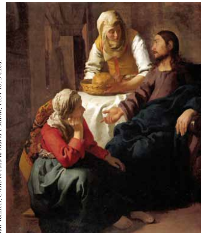
Jan Vermeer, Cristo in casa di Marta e Maria , 1654-1655 circa.