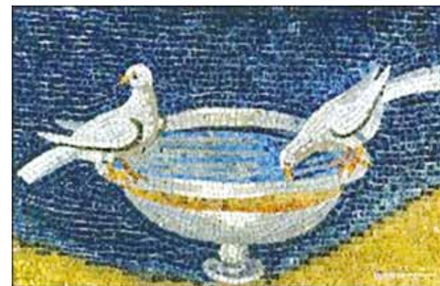
Colombe che si abbeverano (Ravenna, Mausoleo di Galla Placidia)