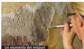
Un momento dei restauri

Venerdì 26 maggio, alle ore 21, la parrocchia Beata Vergine del Rosario in Castiglione Olona presenta i lavori di restauro condotti a termine con importanti scoperte nella chiesa di Madonna in Campagna, in un incontro che si terrà presso la chiesa stessa (sita all'incrocio della Statale Varesina con via Papa Celestino).