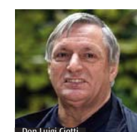
Don Luigi Ciotti

19 (entrata libera), ci sarà l'atleta paraolimpica Nicole Orlando, specialista delle discipline veloci, del salto in lungo e del lancio del giavellotto. Venerdì 26 maggio, alle