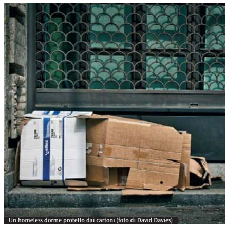
Un homeless dorme protetto dai cartoni

centro Aribetto, all'Istituto Beata Vergine Addolorata (Ibva). Sono sportelli di incontro che orientano come porta d'accesso ai vari servizi di carità offerti dal territorio, per la gran parte utilizzati da persone che non risiedono in centro. Sono presenti in differenti sedi il guardaroba, il dispensario farmaceutico, il centro diurno per senza fissa dimora, la mensa, il servizio doccia, l'aiuto a trovare lavoro, il doposcuola, il centro anti-veneziana, l'assistenza legale, la dispensa alimentare, l'emporio della solidarietà. I numeri e il profilo degli utenti dei centri d'ascolto, migliaia ogni anno, non sono rilevati in modo dettagliato e lo sforzo in corso è quello di realizzare un database comune per sapere dare risposte ogni volta più efficaci alle persone incontrate.