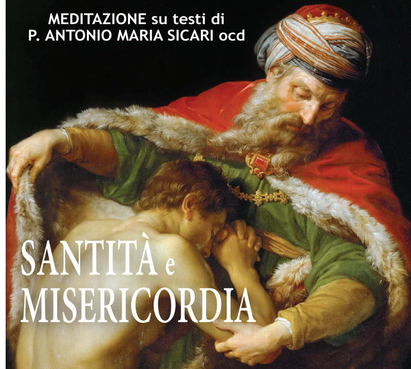
Dipinto di POMPEO BATONI Il ritorno del figliol prodigo 1773