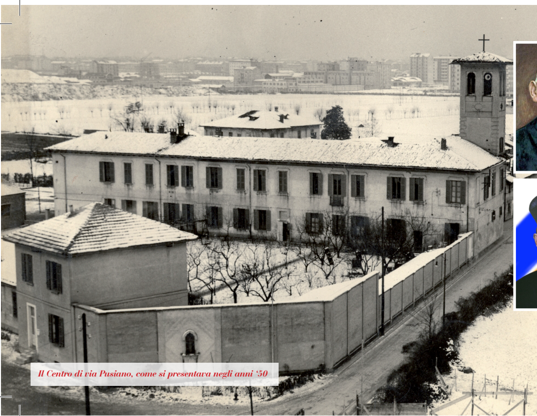
Il Centro di via Pusiano, come si presentava negli anni '50