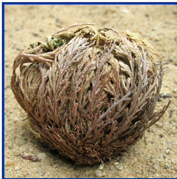
La rosa di Gerico

Abbiamo davanti agli occhi i vizi degli altri, mentre i nostri ci stanno dietro.