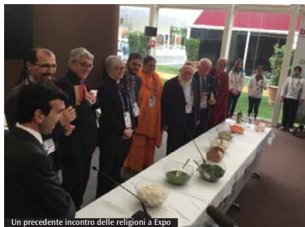
Un precedente incontro delle religioni a Expo