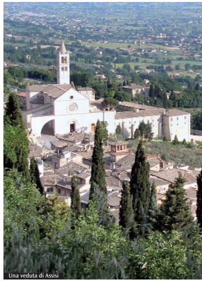
Una veduta di Assisi

Presso il Centro di spiritualità del Santuario di Caravaggio (Bg) si è riunita mercoledì 18 marzo la Conferenza episcopale lombarda (Cel), presieduta dal cardinale Angelo Scola. I vescovi della Lombardia si sono confrontati sulla recezione nelle Diocesi lombarde dell'Esortazione apostolica di papa Francesco «Evangelii Gaudium» e sulla preparazione al Convegno ecclesiale di Firenze del novembre 2015 sul tema «In Gesù Cristo il nuovo umanesimo». Inoltre, monsignor Erminio De Scalzi, presidente del comitato organizzatore del Pellegrinaggio lombardo ad Assisi del 3 e 4 ottobre 2015 per compiere il gesto dell'offerta dell'olio per la «Lampada di san Francesco», ha presentato la lettera di invito firmata dai vescovi di Lombardia indirizzata ai fedeli lombardi (pubblicata qui a sinistra). Infine, la Cel ha esaminato il piano di sostenibilità e qualificazione accademica degli Istituti di Scienze religiose in Lombardia.