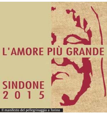
Il manifesto del pellegrinaggio a Torino