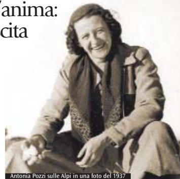
Antonia Pozzi sulle Alpi in una foto del 1937

dedica ad Antonia Pozzi un percorso di immagini e parole per celebrare il centenario della sua nascita. Pasturo fu per Antonia il luogo dell'anima. Vi giunse per la prima volta nel 1918 e da allora il piccolo paese di montagna, ai piedi della Grigna, divenne per lei rifugio e nido, dove le pene, gli sconforti e le angosce, nel silenzio della sua stanza e a contatto con la semplicità dei bambini, dei vecchi, dei contadini, trovavano la pace e si risolvevano in poesia. Pasturo ha sempre ricambiato questo amore, ma oggi lo fa in un modo del tutto particolare, offrendo al nostro sguardo la «vita tutta nutrita dal di dentro» della «sua» Antonia.