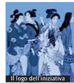
Il logo dell'iniziativa

Al Centro Asteria (piazzale Carrara 17.1 - Milano) per «Echi di vita, armonie dal mondo», festival multiculturale alla seconda edizione, sono in programma tre week-end per conoscere Giappone, America Latina, Africa. L'iniziativa, realizzata con il sostegno di Fondazione Cariplo e il patrocinio del Comune di Milano e del Consiglio di Zona 5, vedrà come protagonisti artisti, musicisti, danzatori, uomini e donne di cultura, imprenditori, artigiani, atleti. Nel fine settimana del 31 marzo - 1 aprile verrà presentato Oriente e Giappone in «Oriente sui Navigli». Ci sarà una sezione di mostre fotografiche e conferenze dedicate alla sensibilizzazione sul nucleare. Le foto sono tutte inedite e originali scattate da giapponesi che abitano in Italia e che sono