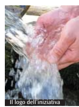
Il logo dell'iniziativa

«Atrio» e «Auzzi», casa di riposo per anziani (Lecco); «Casa e Cascina «Don Guanella»: comunità educativa per ragazzi in difficoltà (Lecco e Valmadrera); Centro «Don Isidoro Meschi»: comunità alloggio per persone affette da hiv/aids (Tabiago di Nibionno). Nel «giardino» di preghiera i partecipanti vivranno insieme l'Eucaristia e condivideranno la