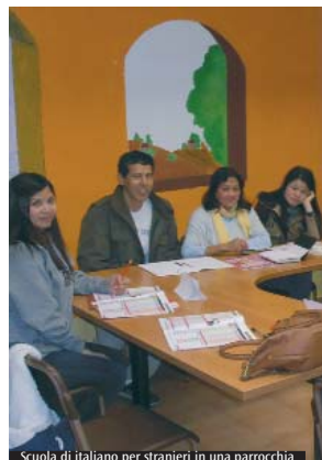
Scuola di italiano per stranieri in una parrocchia

«Farsi prossimo» di due Centri di accoglienza per richiedenti asilo e rifugiati, e già volontario con Caritas in Congo e ad Haiti. «Spesso rimangono impressionati da come i migranti raccontano di alcuni episodi, come ad esempio la morte dei loro parenti. Ai nostri occhi può sembrare che ne parino quasi con freddezza, e ciò può far pensare anche a storie inventate. Ma nella vita di moltissime persone nel Sud del mondo quella della morte è un'esperienza quasi quotidiana. Il loro racconto è dunque in linea con un'esperienza della morte che, a differenza di quanto avviene nella nostra cultura, è di fatto un fenomeno ricorrente e profondamente accettato». Sarà invece uno spaccato sul mondo del web il laboratorio dedicato alla