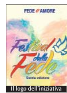
Il logo dell'iniziativa

popolazioni terremotate. Il programma si aprirà con il concerto inaugurale «Note d'amore», musica leggera di ispirazione religiosa (giovedì 23, ore 21, auditorium San Luigi), proseguirà con «Appunti sull'amore e sulla poesia nella Commedia di Dante» (venerdì 24, ore 21, Biblioteca comunale), «Agape, Eros, Philia, tre volti dell'amore» (sabato 25, ore 15, auditorium San Luigi), un viaggio attraverso il cosmo (sabato 25, ore 17, Biblioteca comunale), il cinema e il teatro dei sentimenti (domenica 26,