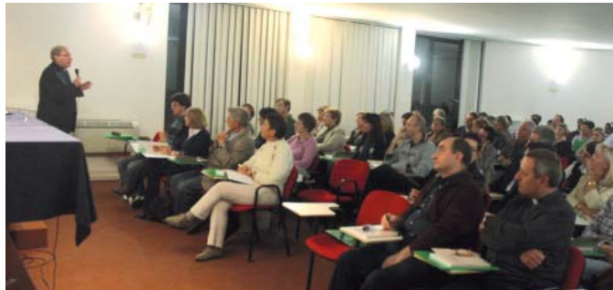
le info sul sito internet

«Filosofia ho studiato, diritto e teologia, e purtroppo, teologia, da capo a fondo, con tutte le mie forze». All'inizio del poema drammatico di Goethe, così Faust nell'angusta stanza gotica dall'alta volta espone il suo sfigo con quel «leider» («purtroppo»): egli forse preferirebbe non praticare teologia, eppure «pare di evincere - non ha potuto farne a meno... Questo apologo può essere utile a introdurre a riflettere sulla domanda di teologia che in questi anni sta lievitando da parte dei fedeli laici che non vogliono rinunciare a intraprendere un viaggio nella teologia cristiana, considerato come un'avventura avvincente e che vale la pena di affrontare. È questo un tratto che merita una sicura attenzione, poiché «pur con i suoi sacrifici richiesti da un'impresa via professionale o dai doveri della famiglia - aumenta sempre più il numero dei cristiani, giovani e adulti, uomini e donne, che si ritagliano spazi per avventurarsi in un itinerario alla ricerca delle ragioni della fede cristiana. Insomma il «purtroppo» di Faust, si trasforma in un «finalmente» o in un «per fortuna». La scelta di seguire un corso di teologia, o un itinerario biblico, o un percorso sull'arte o sulla spiritualità cristiana assume i tratti di una scommessa. Vale la pena misurarsi a intraprendere un viaggio che certamente comporta sacrifici di tempo e obbliga a ritornare sui banchi di scuola, e tuttavia i benefici che se ne possono trarre sono impagabili. La