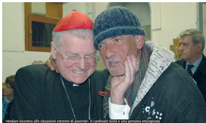
«Andare incontro alle situazioni estreme di povertà». Il cardinale Scola e una persona emarginata