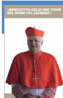
«Benedetto XVI CHE VIENE NEL NOME DEL SIGNORE»