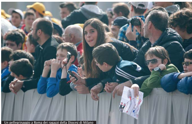
Un pellegrinaggio a Roma dei ragazzi della Diocesi di Milano

reflessioni sul tema della misericordia proposte dai sussidi che il Servizio nazionale di pastorale giovanile ha pubblicato ad hoc: «Oltre a una preparazione tematica è stata anche coltivata un'attesa nei confronti dell'incontro con il Papa e della visita alla città di Roma e ai suoi luoghi significativi - sottolinea don Marelli -». Nell'anno del Giubileo e della Giornata mondiale della gioventù, il Papa non dimentica i ragazzi più piccoli, quelli dai 13 ai 16 anni, che, appunto, non hanno ancora l'età per partecipare alla Gmg e li convoca a un incontro organizzato appositamente per