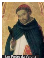
San Pietro da Verona

In occasione della Festa di San Pietro da Verona, martire, iniziativa organizzata presso la parrocchia di Sant'Eustorgio (piazza Sant'Eustorgio 1, Milano), Venerdì 22 aprile alle 21 in basilica: incontro con un esponente della Comunità di Sant'Egidio sul tema «Opere di misericordia oggi». Domenica 24 aprile alle 8.30, apertura della basilica; alle 9.30, 11, 12.30 e 17 Sante Messe. Bacio della reliquia in sacrestia monumentale dalle 9 alle 17. Venerazione della reliquia del capo di san Pietro nell'atrio delle cappelle Soltariane dalle 9.30 alle 16.30. Venerazione della tomba del martire