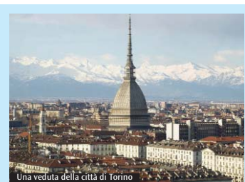
Una veduta della città di Torino

l'altro, una delle opere di misericordia è appunto "alloggiare i pellegrini". Per i gruppi già iscritti, è ancora possibile aggiungere altri partecipanti: i kit aggiuntivi dovranno essere ritirati nei giorni del Giubileo, in via della Conciliazione 7 a Roma. I gruppi che desiderano partecipare provvedendo autonomamente a organizzare i propri pernottamenti e pasti dovranno riferirsi al sito www.gmg2016.it/giubileo-dei-ragazzi/ . Info, e-mail: giovani@chiesacattolica.it . È consigliato partire nella serata di venerdì 22 o nelle prime ore del mattino di sabato 23 per inserirsi appena possibile nel percorso penitenziale con il passaggio attraverso la Porta Santa nella basilica di San Pietro. (N.P.)