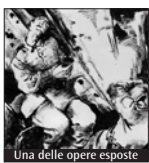
Una delle opere esposte