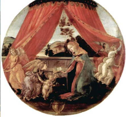
«Madonna del Padiglione» (1493 circa), Pinacoteca Ambrosiana, Milano. A sinistra, «Natività mistica» (1501), olio su tela, National Gallery, Londra