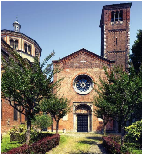
San Celso, accanto a Santa Maria dei Miracoli; sotto, l'interno e una Madonna del XII sec.

Sei secoli più tardi, alla vigilia dell'anno Mille, un altro arcivescovo milanese, Landolfo II da Carcano, volle fondare proprio in questi spazi un monastero bene-