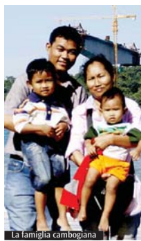
La famiglia cambogiana

Ha raggiunto la cifra di 41.420 euro il Fondo accoglienza famiglie dal mondo. La somma ha già consentito all'ufficio missionario della Curia di Milano che gestisce il «borsello» per conto della Fondazione Milano Famiglie, di aiutare già 24 famiglie provenienti da Zambia, Bielorussia e Brasile a coprire le spese di viaggio per venire a Milano in occasione dell'Incontro mondiale delle famiglie con il Papa. «L'Incontro mondiale, fedele alla sua vocazione di internazionalità, di apertura e di accoglienza verso nuclei familiari anche lontani, non vuole essere una promessa di gioia solo per chi può permettersi di partire, bensì un'esperienza di condivisione che deve essere accessibile a tutti - dicono dalla Fondazione. Quelle famiglie che, in ristrettezze economiche, non possono affrontare, pur desiderandolo, il costo del viaggio per aprirsi all'esperienza dell'Incontro con il Papa o non possono permettersi di far partecipare tutti i membri, devono poter essere ascoltate, portare a Milano la propria storia, condividere le proprie difficoltà». Per contribuire: donazioni sul c/c IT 1600306901629100000014189, specificando nella causale «Gemelli per Family 2012». (F.C.)