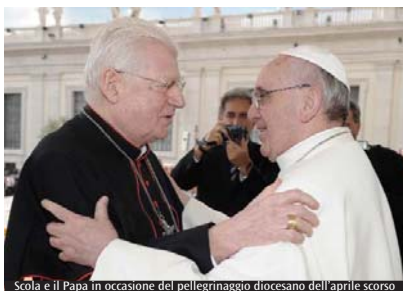
Scola e il Papa in occasione del pellegrinaggio diocesano dell'aprile scorso