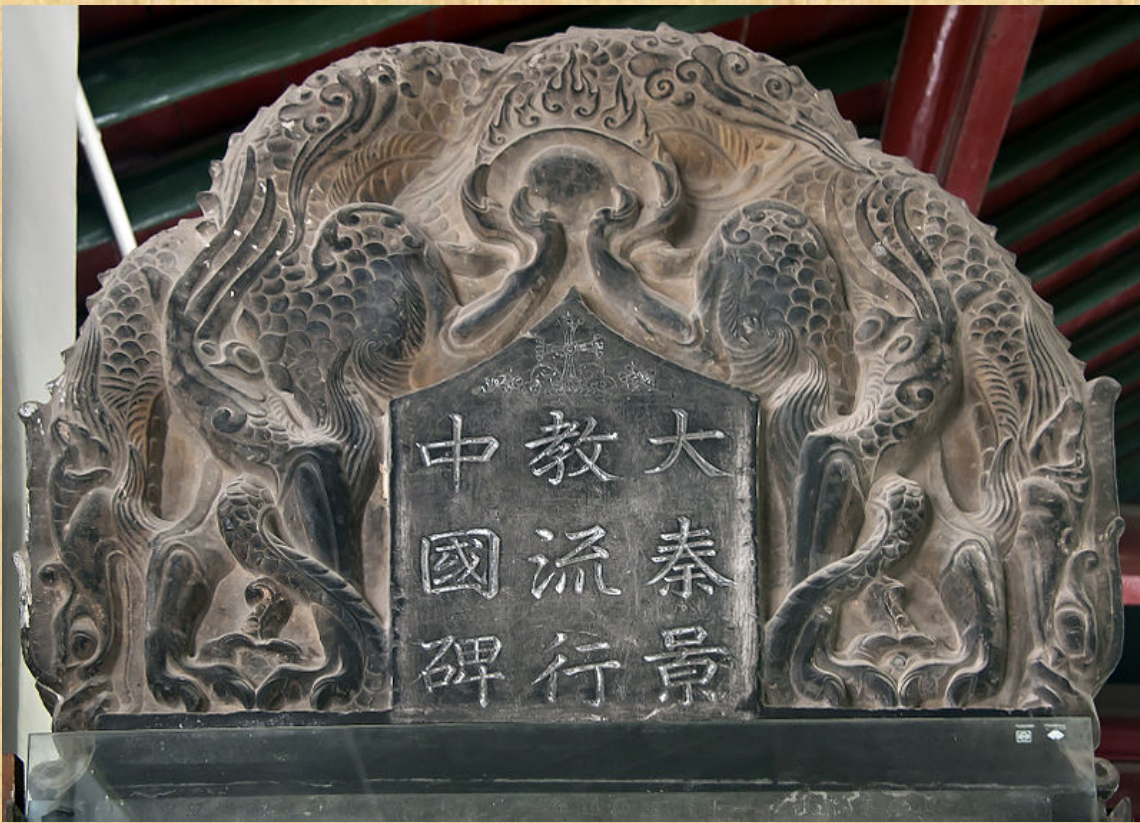
Stele di Xi'an, particolare