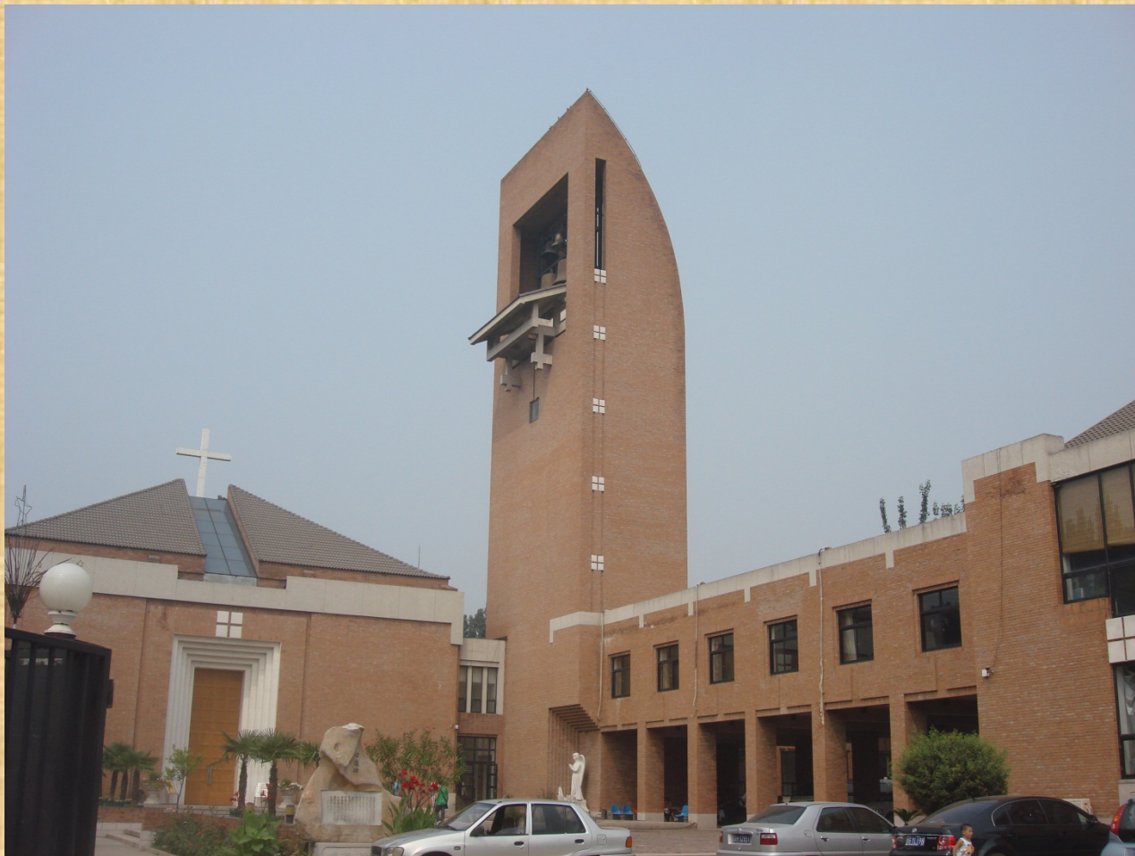
Seminario di Pechino