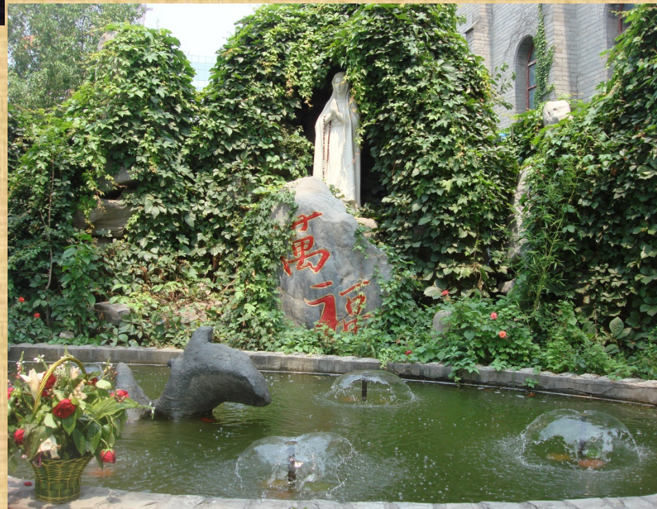
Nantang, giardino con statua della Vergine Maria