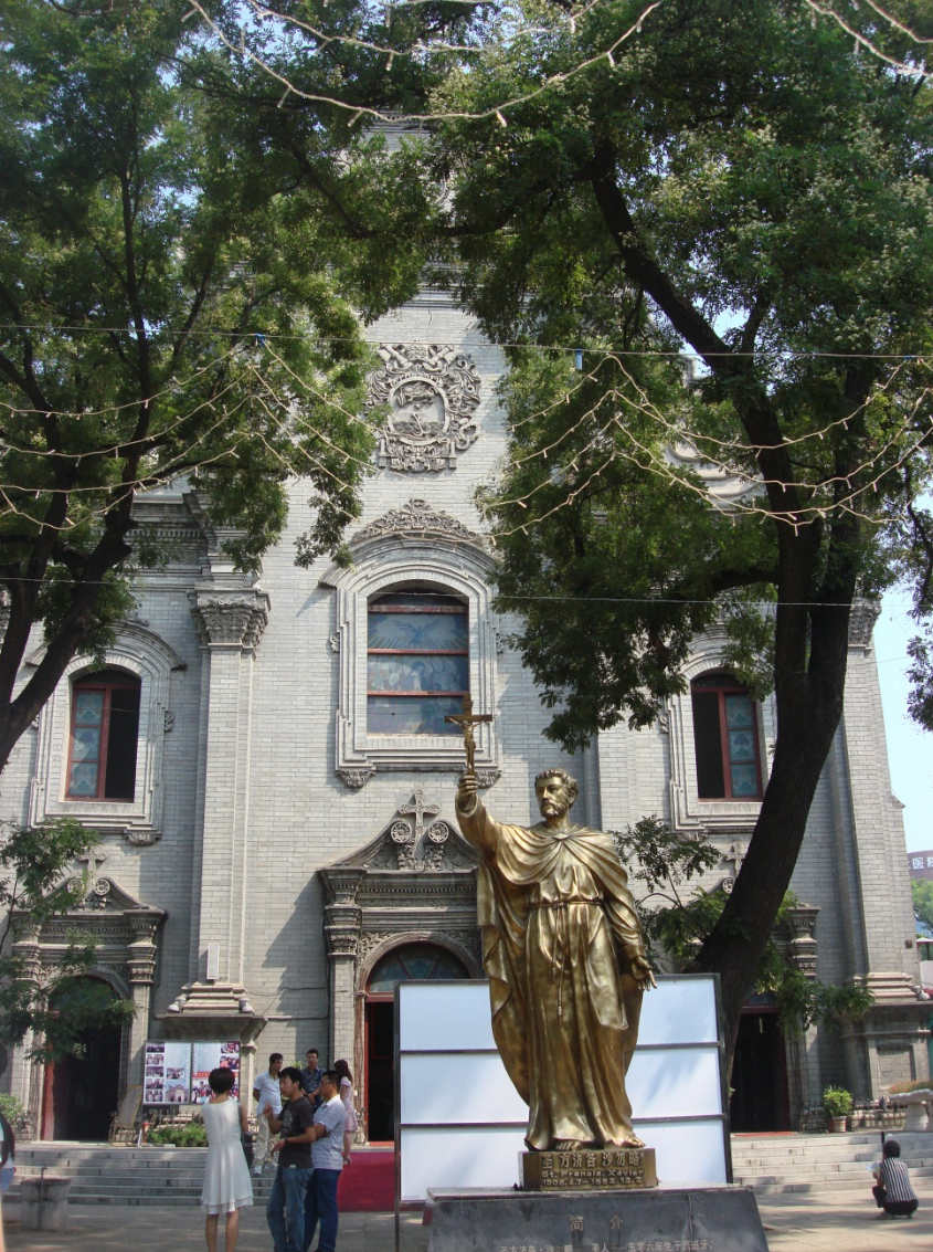
Cattedrale dell'Immacolata Concezione (Nantang), Pechino, facciata e statua di San Francesco Saverio.