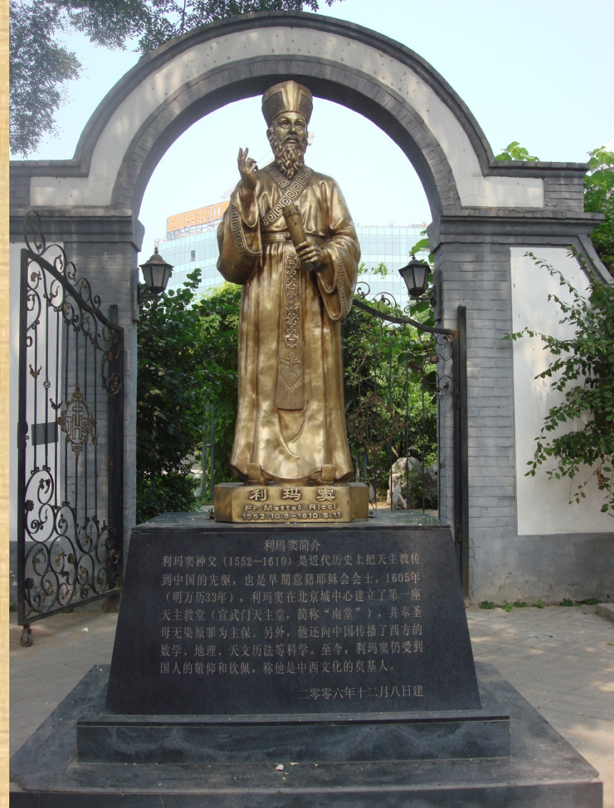
Cattedrale dell'Immacolata Concezione (Nantang), Pechino, statua di Matteo Ricci