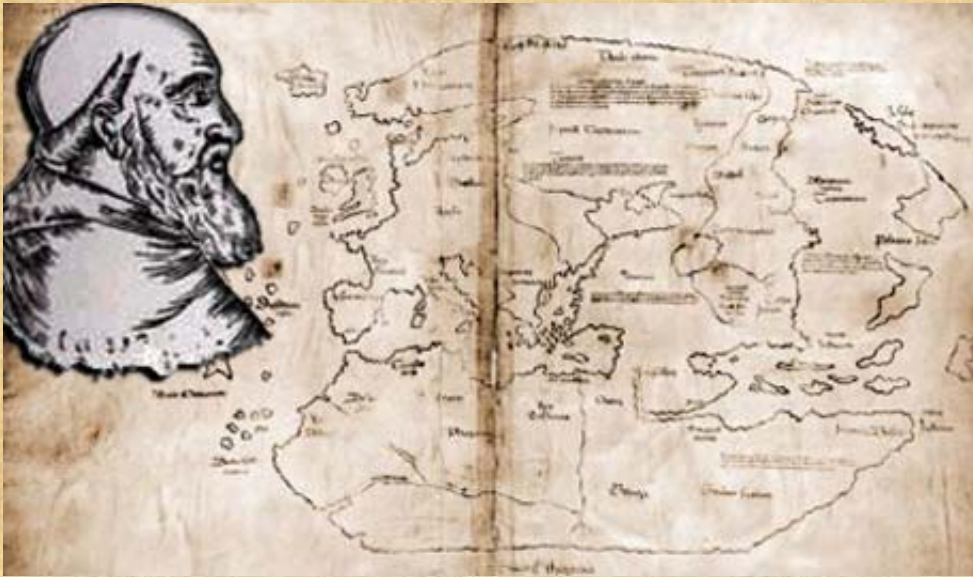
Giovanni da Pian del Carpine e il suo itinerario