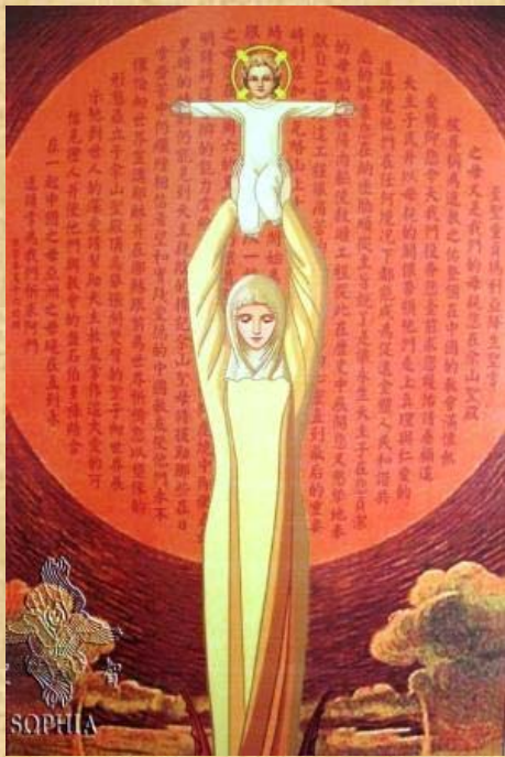
Madonna di Sheshan

24 maggio Giornata di preghiera per i cristiani in Cina, affidata alla protezione della Madonna di Sheshan, aiuto dei cristiani