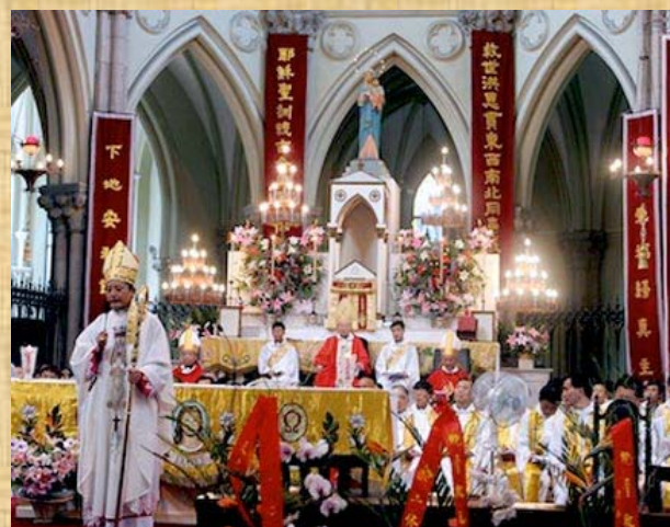
Cattedrale di S. Ignazio, Shanghai