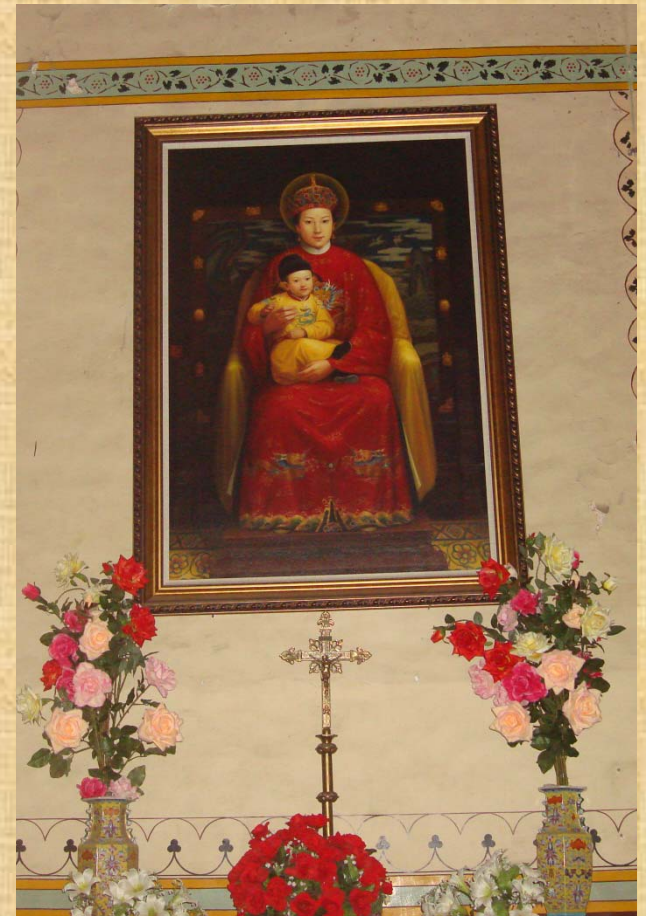
Beitang, Pechino, interno e cappella laterale