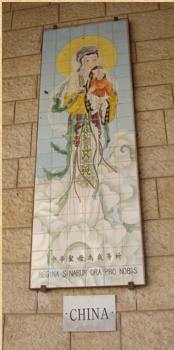
«Nostra Signora della Cina», Nazareth, Basilica dell'Annunciazione

“La fede non conosce confini, se non quelli della propria coscienza”