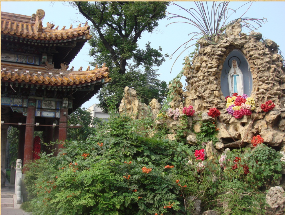
Beitang, Pechino, cortile e facciata