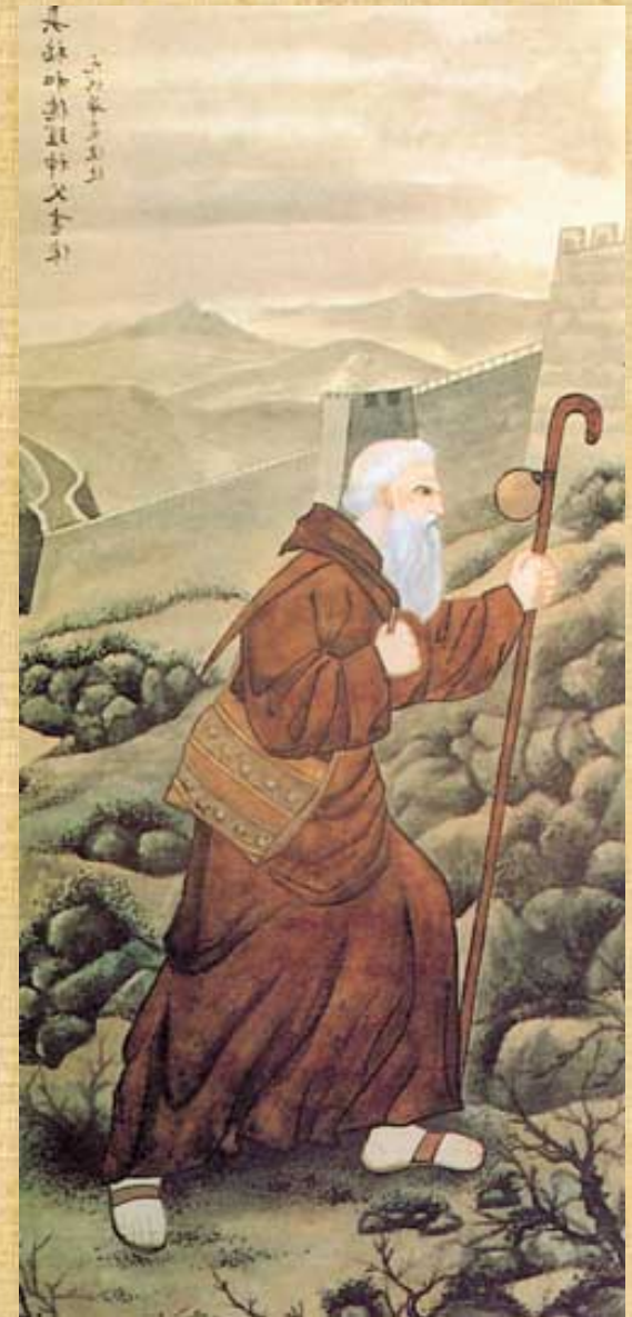
Giovanni da Montecorvino