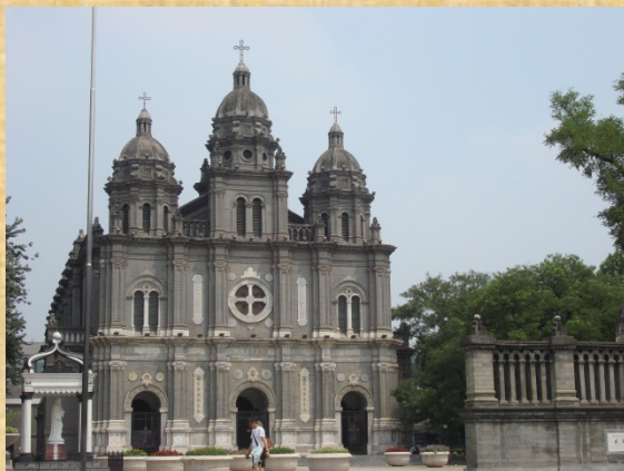
Xitang, Chiesa di San Giuseppe, Pechino