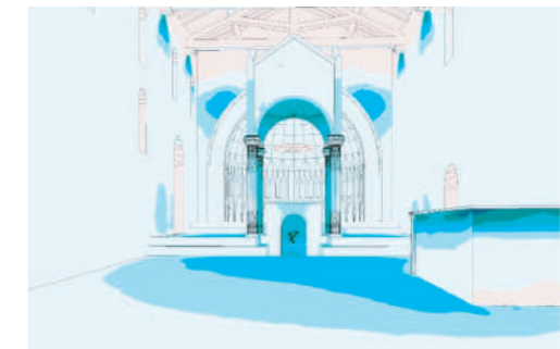
Rendering S.L. Designer M.C. Genoni

e immediatezza negli interventi di manutenzione ordinaria e straordinaria