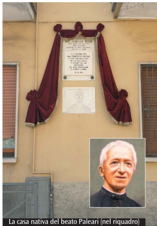
La casa nativa del beato Paleari (nel riquadro)