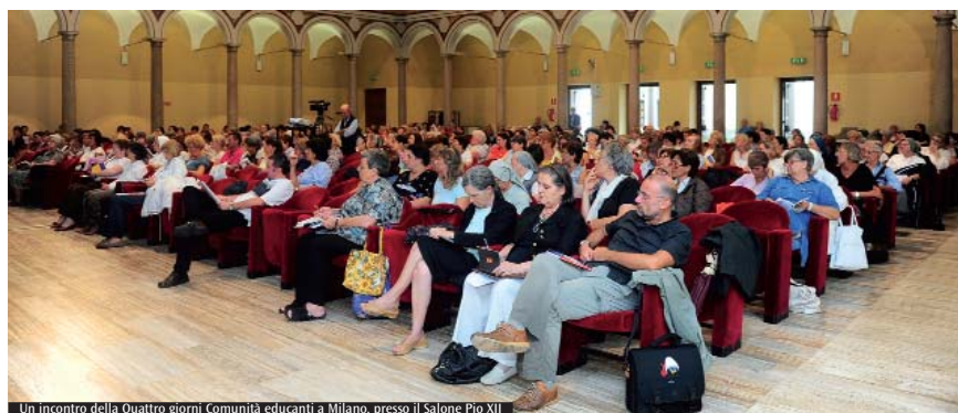
Un incontro della Quattro giorni Comunità educanti a Milano, presso il Salone Pio XII

Zona V (Monza) - Cine-teatro Excelsior di Cesano Maderno (via San Carlo 20): 5, 7, 12, e 14, ore 15. Oratorio parrocchiale di Goncesio (via De Giorgi 56): 4, 6, 11 e 13 settembre, ore 20.45. Zona VI (Melegnano) - Cine-teatro Arcobaleno di Motta Visconti (via San Luigi 4): 11, 13, 18 e 20 settembre, ore 20.45. Oratorio parrocchiale di Mezzo (via Orsenigo 7): 11, 13, 18 e 20 settembre, ore 20.45. Zona VII (Sesto San Giovanni) - Cinema Teatro Agorà di Cernusco sul Naviglio (via Melloni 37): 18, 20, 25 e 27 settembre, ore 20.45. Per iscriversi alla Quattro giorni Comunità educanti ci sono due modalità. Online sul sito www.centropalealembrosiano.it e selezionando Quattro giorni Comunità educanti occorre cliccare sulla sede di partecipazione scelta. È possibile iscriversi singolarmente o a gruppi registrandosi e compilando i campi richiesti. Per completare questa modalità di iscrizione sarà necessario effettuare il pagamento con carta di credito o prepagata. Oppure si possono effettuare le iscrizioni presso le segreterie decanali. Accedendo al sito www.centropalealembrosiano.it è possibile rintracciare la segreteria decanale più vicina con i relativi orari di apertura. Presso dette segreterie è possibile effettuare l'iscrizione e il pagamento in contanti per singole persone o per gruppi. Quota di iscrizione: euro 20. Informazioni: Servizio per la catechesi ( diocesi.milano.it ).