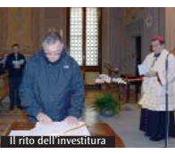
Il rito dell'investitura