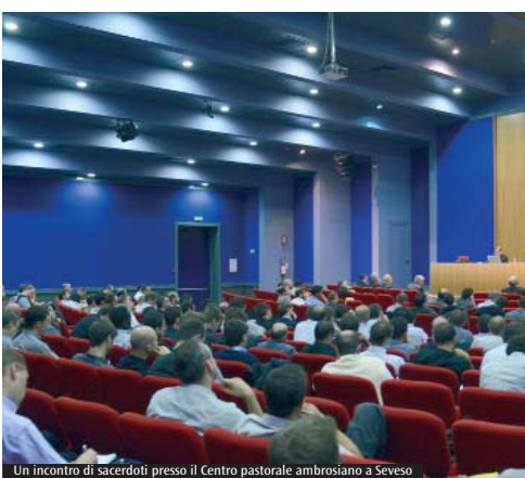
Un incontro di sacerdoti presso il Centro pastorale ambrosiano a Seveso