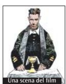
Una scena del film

doppiaggio è stato effettuato al Centro «Santa Maria Nascente» di Milano. Per questo lavoro - diretto da Matteo Bonanni - sono stati coinvolti attori professionisti, giovani studenti della scuola «Teatro pedonale» di Agrate Brianza, oltre ad alcuni bambini, con il contributo musicale del fisarmonicista Matteo Curatella, insieme ad altri brani e al canto «Steluti alpini», caro a don Gnocchi, nella versione incisa dal Coro Ana di Milano, diretto dal maestro Massimo Marchesotti. In tutto, sono state assemblate quasi