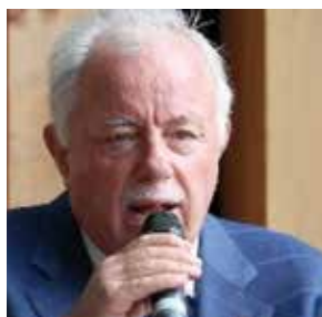
4 marzo Giuseppe Platone pastore titolare della chiesa valdese di Milano giornalista, già direttore del settimanale protestante «Riforma»