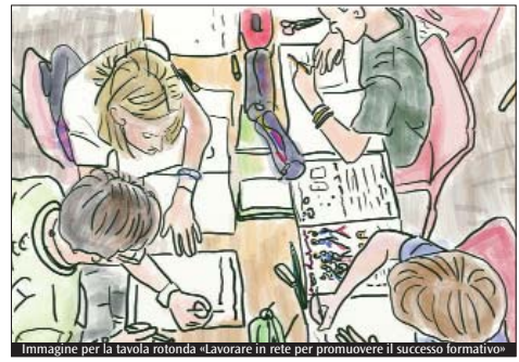
Immagine per la tavola rotonda «Lavorare in rete per promuovere il successo formativo»