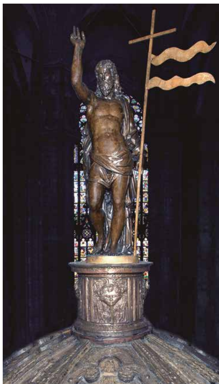
Milano, Duomo: Cristo risorto alla sommità del Ciborio (bronzo dorato, seconda metà del XVI sec.)

Luca 11,3 aggiunge alla richiesta «ogni giorno», quasi voglia estendere a tutti giorni della settimana, quello che originariamente era pensato solo in previsione del sabato. Il motivo potrebbe essere di voler esplicitare il senso del settimo giorno per coloro che non erano di cultura ebraica, perché non è in gioco il sabato settimanale, ma il settimo giorno di Dio ( Genesi 2,1-4a), il Grande Sabato di tutta la storia del mondo. Questo è detto anche dal Targûm di Esodo 20,11, purtroppo frammentario: «chiunque onora il sabato è simile a colui che mi onora sul mio trono di gloria; poiché a causa dell'onore