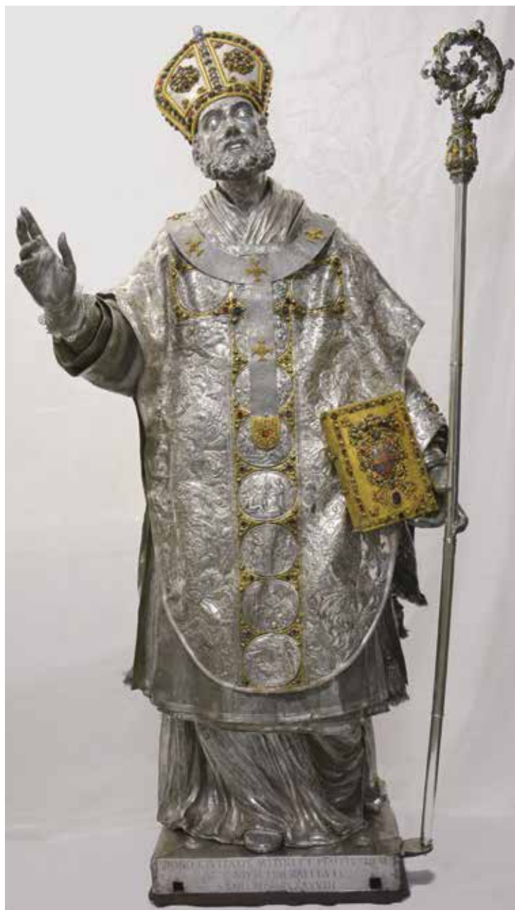
Milano, Duomo: Sant' Ambrogio, dopo il recente intervento di restauro (statua argentea, 1698)

Potremmo titolare questa nuova "classe di conferenze" Cattedrale e dintorni , e in essa offriremo letture storico-artistiche e liturgico-teologiche per illustrare i restauri compiuti in Cattedrale o nelle sue vicinanze, alcuni eventi che hanno luogo in Duomo e anche alcune pagine di liturgia che in esso sono celebrate nella cornice particolare del Rito ambrosiano.