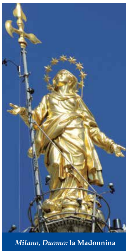
Milano, Duomo: la Madonnina

U n grande progetto, rappresentazione di uno straordinario racconto: la Veneranda Fabbrica del Duomo . Un affresco che va alle sorgenti della storia di Milano, per riaffermare l'energia di un Monumento che, nei secoli, è stato eletto come pilastro della città, centro di fede e di abbraccio tra il territorio e il resto del mondo. In questo luogo di straordinaria bellezza, si è forgiata l'identità stessa di Milano. Dall'epoca di Leonardo a quella di Napoleone, da Johann Christian Bach (figlio del più noto Johann Sebastian e organista titolare del Duomo, nella seconda metà del XVIII secolo) ai contemporanei, fino alle trasformazioni tecnologiche, la Veneranda Fabbrica è sempre stata al servizio del culto e del Monumento simbolo della città, all'avanguardia nella ricerca del bello e dei nuovi linguaggi con cui misurarsi. Aprirsi al mondo e accogliere i milioni di fedeli e visitatori, attesi per il grande evento di Expo , significa riscoprire l'emozione di appartenere a questo racconto, per vivere l'incontro con il pianeta, nella fierezza di una proposta culturale tutta italiana.