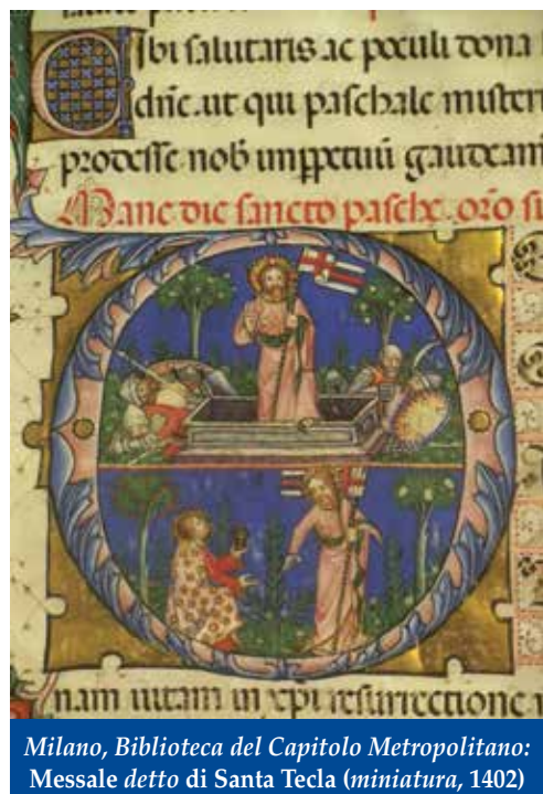
Milano, Biblioteca del Capitolo Metropolitano: Messale detto di Santa Tecla (miniatura, 1402)