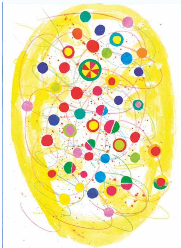
Milano, Duomo: Evangelario ambrosiano, Nicola De Maria, Domenica delle palme, Messa nel giorno (per gentile concessione di Sua Eminenza il cardinale Dionigi Tettamanzi)

E Gesù c'è; in alto, vero e unico motore di questo espandersi dell'aroma e del radunarsi dei tanti elementi in una comunione: "principio e fine di ogni cosa". Gesù è presente: in quella forma circolare segnata da una croce rossa, in un cerchio giallo, contornata da un verde luminoso. È la traduzione in forme e colori del senso del gesto della donna e rivelato dallo stesso Gesù, in risposta all'avarizia e alla codarda cecità di Giuda: «Lasciala fare, perché ella lo conservi per il giorno della mia